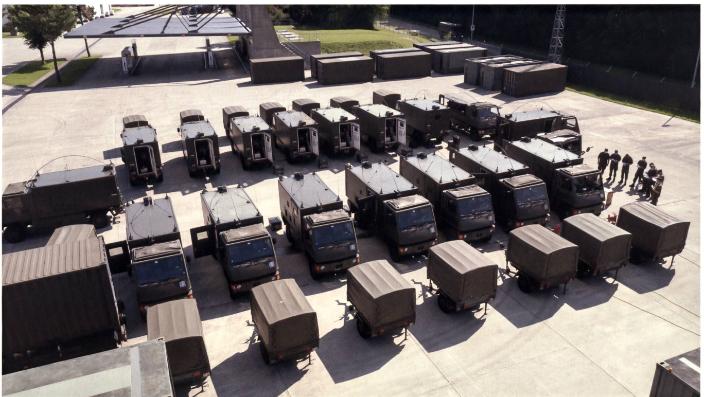
Mise en place d'un microdispo.

L'exercice LINK a eu lieu en juin 2021 dans la région de Winterthur et a eu pour but d'exercer nos troupes du bat aide cdmt 41 dans une situation réaliste. Après une donnée d'ordre, un exercice impliquant les moyens de télécommunication commence toujours par un contrôle de la fonctionnalité du matériel ainsi que la mise en place d'un Microdispo. Cette configuration a pour but de tester en miniature la réalité du terrain et de contrôler les paramètres des systèmes afin de s'assurer du bon fonctionnement du matériel. Tout ceci