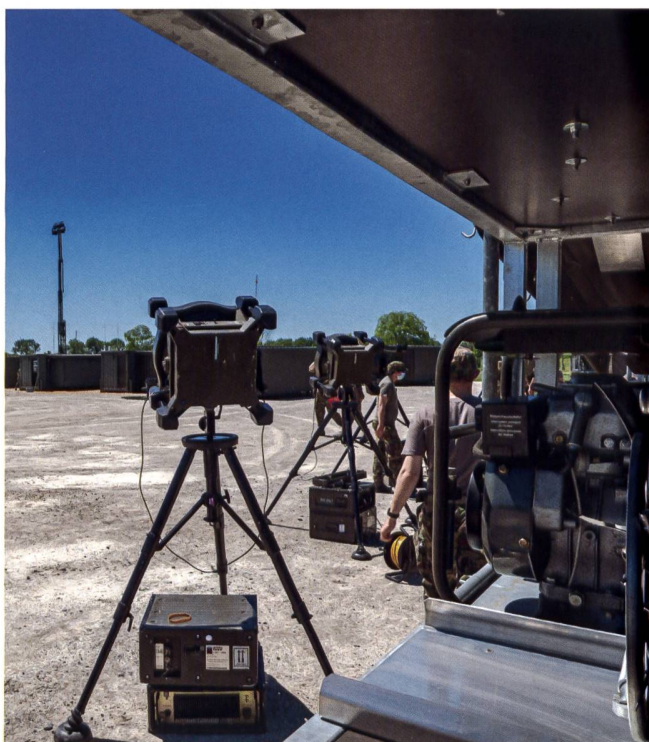
Une antenne R-905 utilisée lors du microdispo.