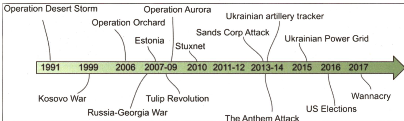
Figure 2: Représentation d'événements importants pouvant être compris dans le contexte des cyberguerres.

La Russie poursuit en revanche un développement asymétrique des capacités dans la sphère d'opération cyber. Après la dissolution des services secrets soviétiques (KGB), quatre organisations ont été créées. Le FSO pour la protection du président, le FSB comme service de renseignement intérieur et le SWR comme service