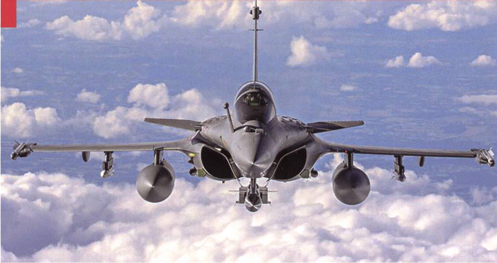
Le Rafale (ci-contre) est en train de reprendre la mission de frappe stratégique remplie depuis le milieu des années 1990 par le Mirage 2000 N (ci-dessous).