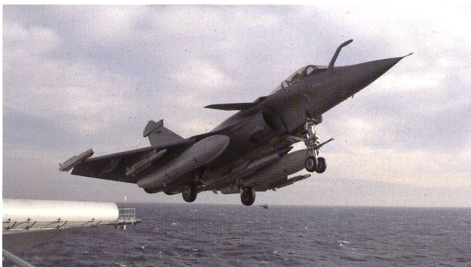
Ci-dessus : Le porte-avions à propulsion nucléaire (PAN) est un moyen permettant d'allonger la portée de la frappe stratégique.

du processus de modernisation, de mise en œuvre opérationnelle des forces et le renouvellement des systèmes. Ainsi, en 2018 pour la première fois depuis près de 20 ans, la barre des 4 Mds € était franchi et atteint en 2021 le niveau de 5 Mds €. Un chiffre qui dès 2023 atteindra 6 Mds € ; un montant annuel qui devrait être celui de ces 15 prochaines années 13 pour pouvoir réaliser l'ensemble des opérations.