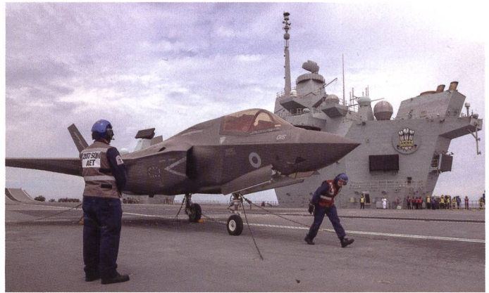
Un F-35-B sur le pont du HMS Prince of Wales (R09). La Royal Air Force a déjà reçu 27 appareils; 42 appareils doivent arriver d'ici la fin 2023; 38 ont été commandés en 2021.

Propos recueillis et traduits par le col EMG Alexandre Vautravers