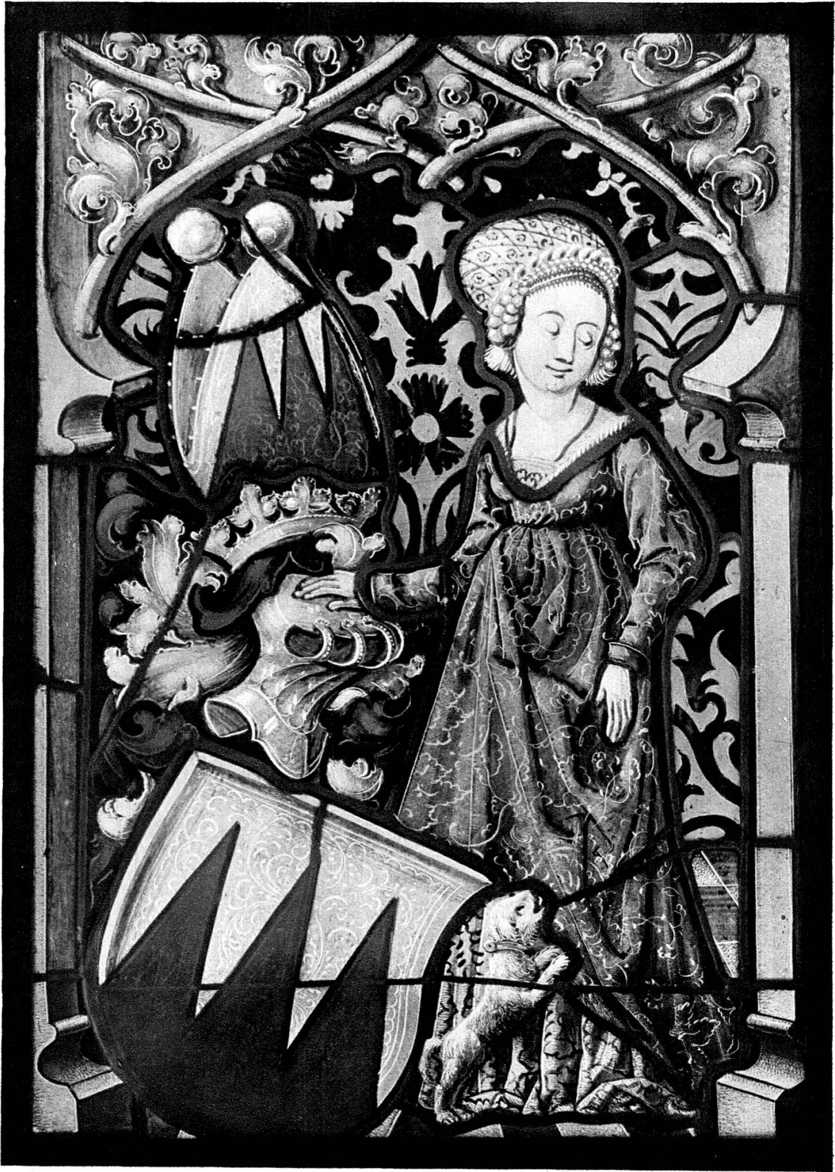
Vitrail aux armes du comte de Sulz vers 1500