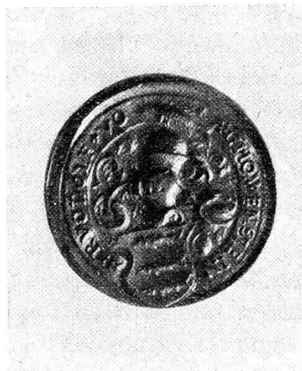
Abb. 2 Siegel des Ritters Rudolf von Schauenstein