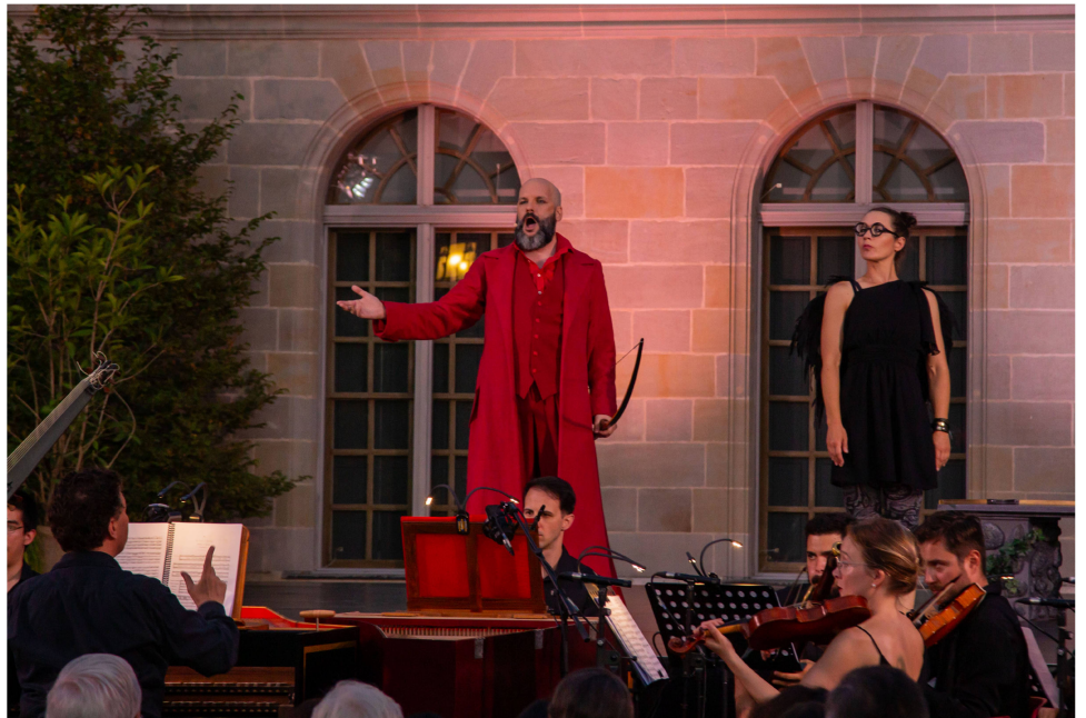
Représentation d' Apollon et Daphné dans la cour du château à l'occasion du festival Prangins Baroque .

Une nouvelle formule d'activités pour célébrer Halloween a permis d'accueillir le public dans de meilleures conditions que l'année précédente, où le musée avait été pris d'assaut, ce qui avait entraîné de longues files d'attente et un manque de place. La Journée des Châteaux suisses, consacrée aux Animaux & créatures fantastiques, a attiré plus de 1600 personnes.