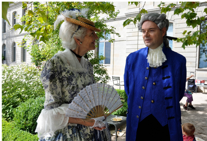
Les descendant-e-s de la famille Guiguer se réunissent au château pour des visites guidées et un pique-nique.

À l'été 2022, une panne du système de refroidissement avait entraîné une très forte hausse des températures dans l'ensemble du château, ce qui rendait les visites déplaisantes. Une nouvelle installation a été mise en service en 2023 juste avant les chaleurs estivales.