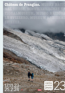
Affiches des expositions qui ont été inaugurées en 2023.