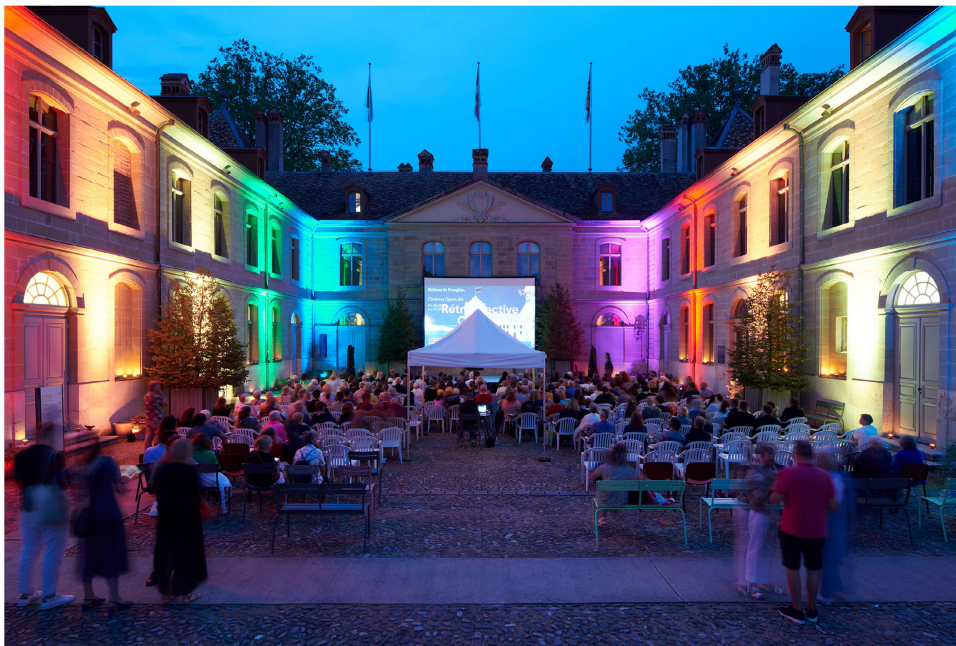
Cinéma en plein air dans la cour du Château de Prangins.

Le Cinéma Open Air s'est enrichi d'un nouveau partenaire avec la Cinémathèque suisse. Pour marquer le 25 e anniversaire de l'ouverture du château au public, trois films de fiction ont montré comment les châteaux nourrissent l'imaginaire cinématographique depuis des décennies. Pour la première fois, une soirée était spécialement consacrée au jeune public. Avec 850 personnes sur les trois jours, cette 7 e édition a connu le plus grand succès en termes de fréquentation.