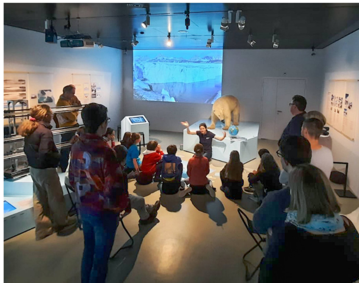
Atelier dans l'exposition «Le Groenland en 1912»

Douze ans après son lancement, l'exposition permanente «Les origines de la Suisse» reste très appréciée des groupes scolaires. Durant l'année sous revue, «History Run Schwyz» a également été le programme le plus réservé par les enseignant-e-s. Au total, 87 classes ont visité le Forum de l'histoire suisse Schwytz: 52 en combinaison avec le programme «History Run Schwyz», et 24 avec une visite guidée de l'exposition permanente. Comparativement à l'année précédente, les groupes d'adultes ont réservé davantage de visites guidées; les visites de l'exposition destinées aux familles ont également connu une belle fréquentation.