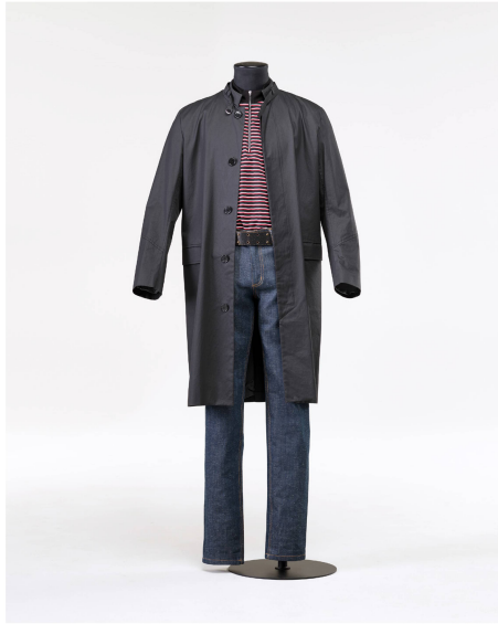
Ensemble confection hommes de Stefan Steiner, composé d'un T-shirt, d'un jean et d'un manteau, collections printemps-été de 2012 à 2016.