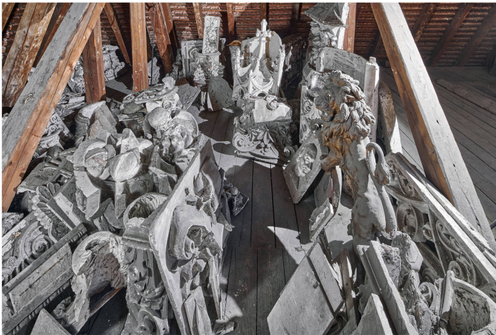
Moulages de plâtre de Gustav Gull entreposés dans le grenier de l'école Lavater de Zurich-Enge, 1897–2022, photographie datant du printemps 2022.