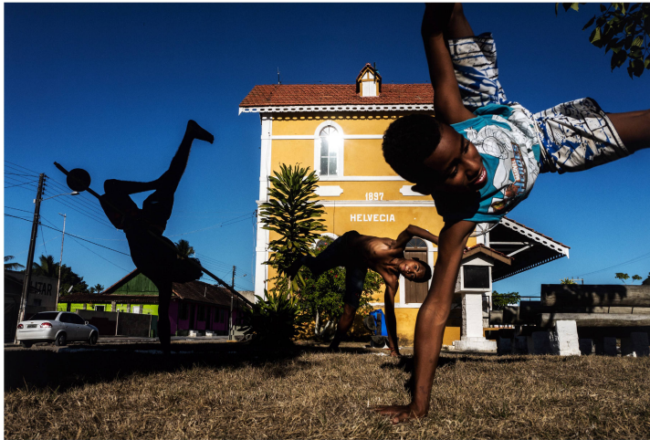
Trois élèves de l'école «Arte Capoeira Bahia» devant le bâtiment de l'ancienne gare avec l'inscription «HELVECIA», Dom Smaz, 2015.