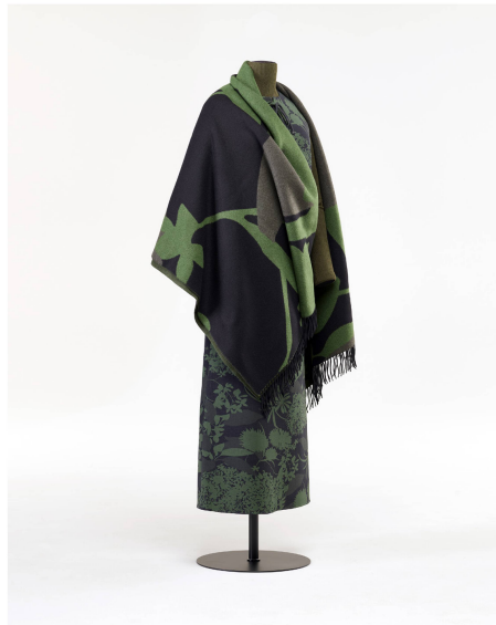
Ensemble Akris, Saint-Gall. Écharpe, veste, pulllover et jupe. Collection automne-hiver 2023.

Pour la saison automne-hiver 2023, le designer de la marque de mode suisse Akris Albert Kriemler s'est inspiré d'une fleur de la soierie zurichoise Abraham. Cette fleur figure sur un imprimé de 1976 qu'Abraham avait créé pour Yves Saint Laurent. Elle est reprise dans la collection Akris sous une forme abstraite, agrandie et déclinée en plusieurs nuances de couleur. Pendant le processus de création de la collection, l'équipe d'Akris a effectué des recherches sur la société Abraham dans les archives du Centre d'études du Musée national Zurich. Le MNS a eu l'honneur de recevoir en cadeau de la part d'Akris le Look 25, composé d'une jupe, d'un haut avec gilet en laine et d'une écharpe volumineuse.