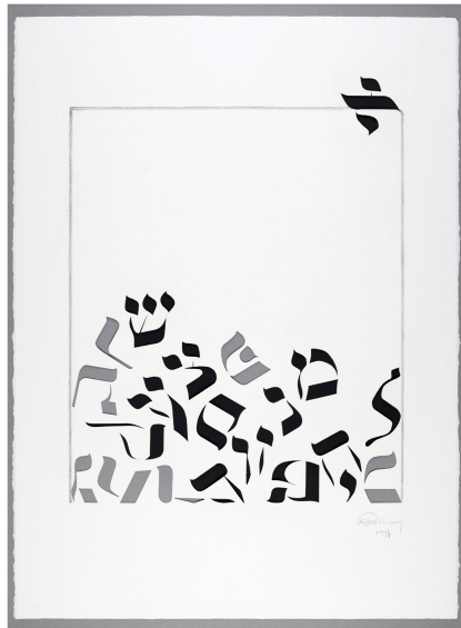
«Survivor» de Fishel Rabinowicz (*1924), découpage, 1994.