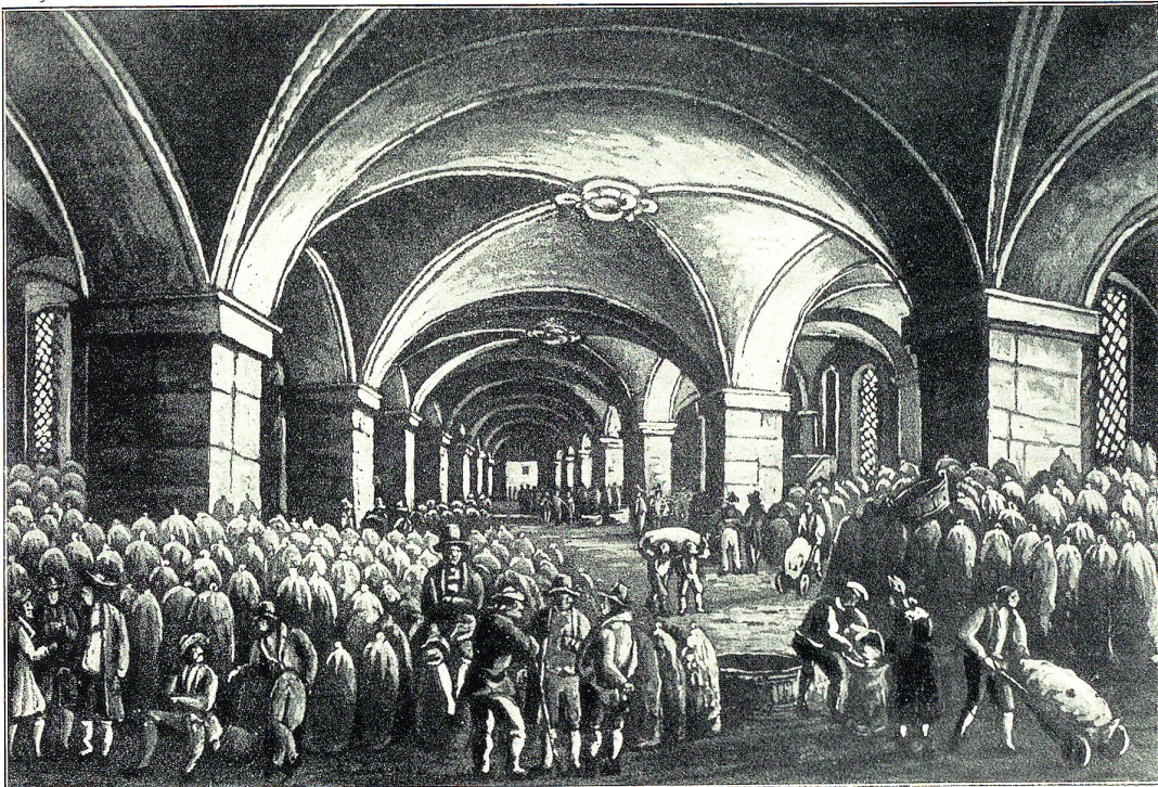
Gute Zeiten im Rorschacher Kornhaufe.

Auf ähnliche Weise wurden auch in den andern Häfen des Bodensees einzelne Private Schiffahrtsberechtigt. So gaben z. B. 1763 die Grafen von Montfort das Schiffahrts- recht in Langenargen an 8 Schiffer für 9 Jahre gegen die jährliche Leistung von 90 Gulden. Daraus entwickelte sich dann später für die württembergische Hafendirektion in Friedrichshafen die Verpflichtung, bei Todesfall die Erben in das Schiffsgeschäft eintreten zu lassen. An grö- ßeren Orten organisierten sich die Schiffsleute zu Zünften,