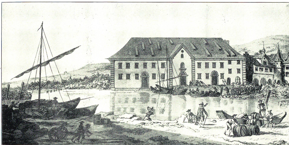
Kaufhaus und Schiffslände zu Rorschach.

Nach dem Gefagten dürfen wir auch den Fleißungen der Dampfschiffverwaltung im ersten Jahresberichte vollen Glauben schenken, „daß es eine ihrer schwierigsten Aufgaben war, die verschiedenen bisherigen durch Uebung, Gewohnheit und Rücksichten aller Art verschlossenen Uferplätze des Sees und des Rheins bis Schaffhausen zum erstrebten Zwecke zu gewinnen und zu vereinen“ (1831). Ruhiger Verkehr, kluge Berücksichtigung der bestehenden Rechte öffneten die Wege. Gleich anfangs brachte die Vermittlung des Handelsstandes von Lindau einen Vertrag für die Verladung der Güter und Passagiere nach