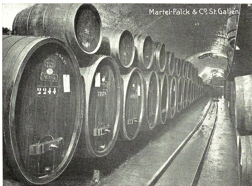
Martel-Falck & Co. St. Gallen.

„Lieblich winket der Wein, wenn er Empfindungen, Bessere, sanftere Lust, wenn er Gedanken winkt, Im sokratischen Becher, Von der tauenden Ros' umkränzt; ... Wenn er lehret verachten, Was nicht würdig des Weisen ist.“ A. X.