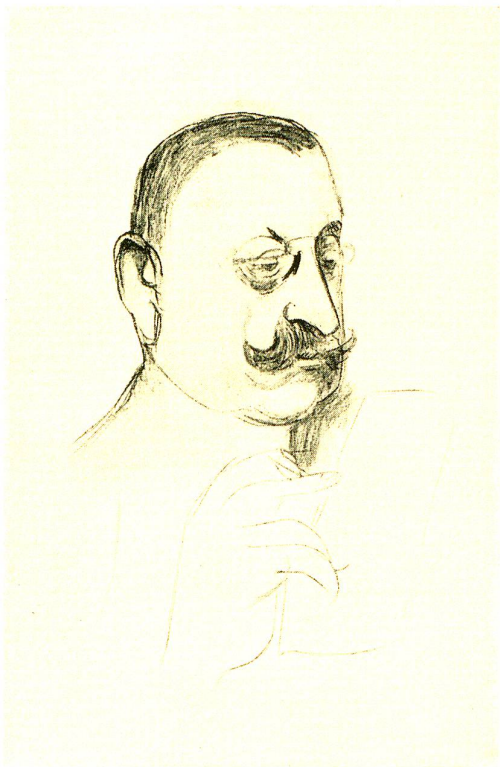
Nach einer Zeichnung von Rolf Roth, Solothurn