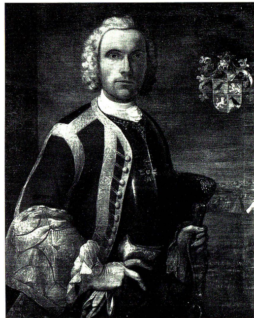
Karl Anton Sartory, 1716–1778 Offizier im Regiment Rüttimann gestorben als Oberstleutnant in Madrid

Daß die Beziehungen der Fürstabtei St. Gallen zu Frankreich nicht vollständig abgebrochen wurden, dafür sorgten die in französischen Diensten stehenden Freiherren von Salis zu Zizers,