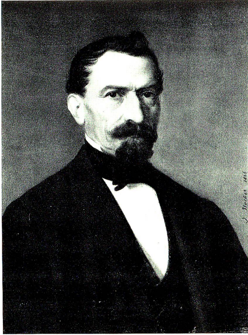
Hauptmann Albert Zardetti, † 1882 Offizier in päpstlichen Diensten

keine solche Militärbündnisse, außer man müßte die Erbeinigung mit dem Haus Oesterreich als solches bezeichnen 1 .