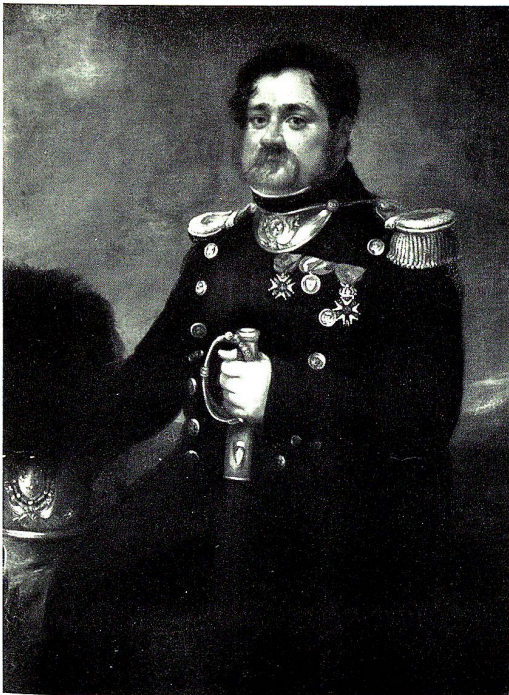
Karl Fidel v. Sartory, 1752–1830 Oberstleutnant im Regiment Rüttimann Eidg. Oberst 1805–1813

Um den Besitz der andern st. gallischen Kompagnie unter dem Regiment Diesbach entspannen sich langwierige Zwiste