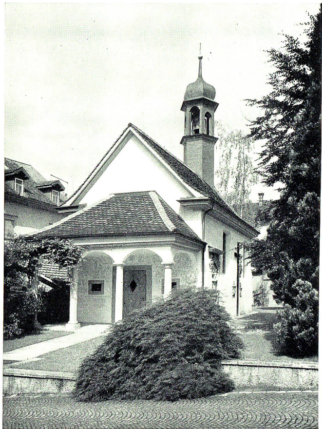
Seelenkapelle von Westen

Wann in Rorschach eine eigene Pfarrei errichtet wurde, ist ungewiß. Erst um 1236 erfahren wir erstmals urkundlich davon. Es ist aber anzunehmen, daß sie bedeutend älter ist. Die heutige Pfarrkirche geht auf die Anlage von 1438 zurück. Sie