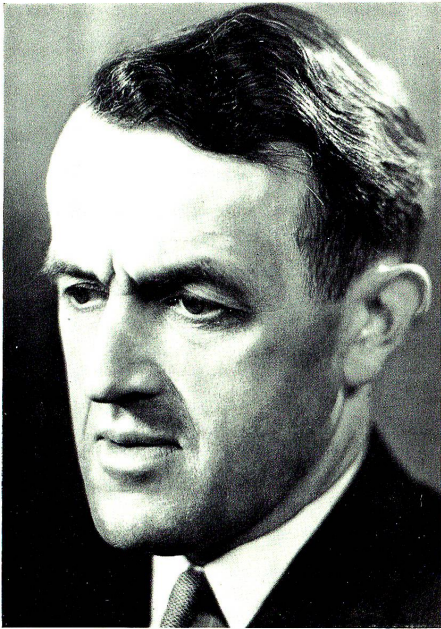
Bundesrat Prof. Dr. Max Petitpierre leitete die Außenpolitik gemäß der Losung «Neutralität und Solidarität» von 1945 bis 1961.

für den Beitritt zum Völkerbund entschieden. Diese sogenannte partielle Neutralität dauerte bis 1938.