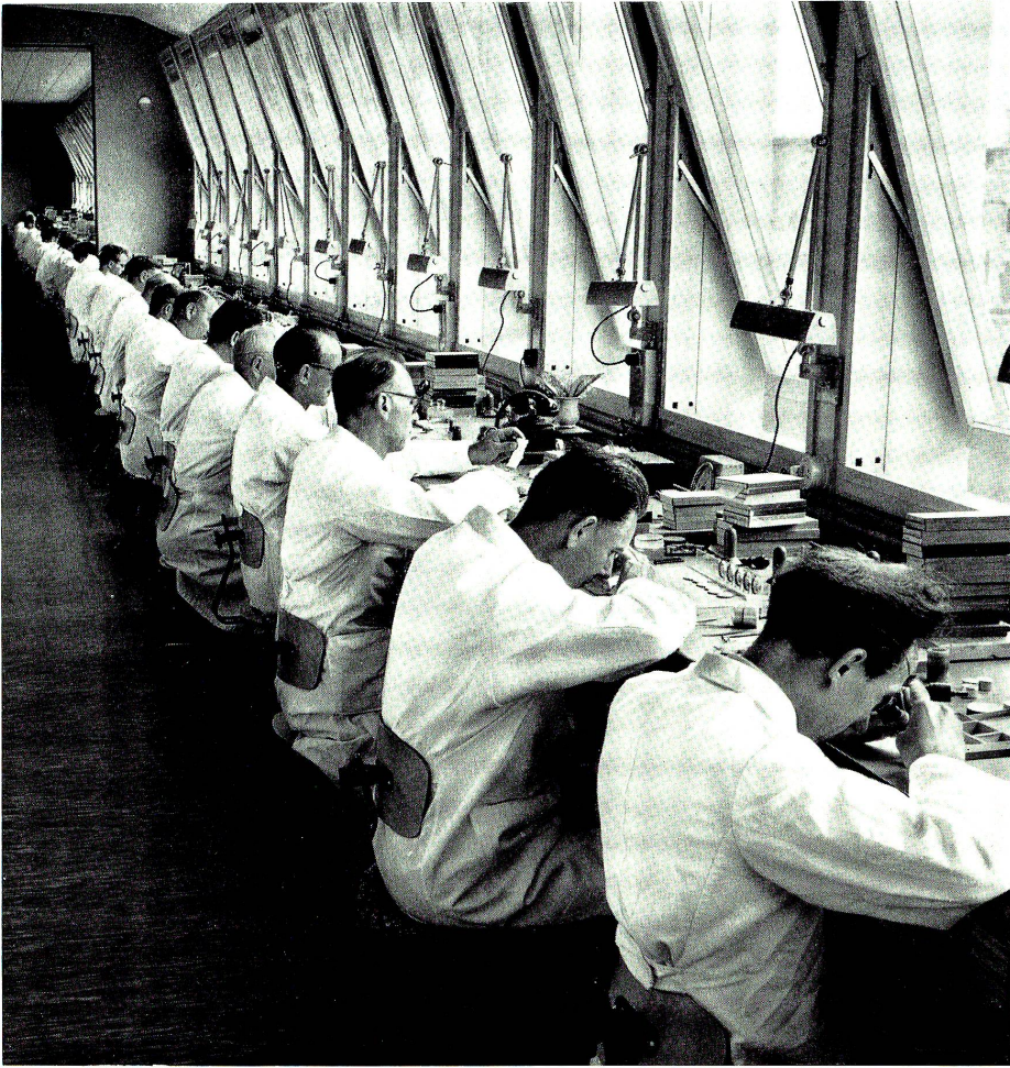
Nach wie vor kann sich die Industrie unseres Kleinstaates auf dem Weltmarkt nur behaupten, wenn sie Waren erster Güte herstellt. Unser Bild zeigt ein Atelier, in welchem Uhrwerke von feinsten Präzision noch einmal sorgsam geprüft werden. (Bild aus: Die Schweiz – heute, Leonhard Rösli, Verlag Sauerländer)

und Gewerbefreiheit erlauben. Zweifellos bedeutete die Rationierung während des Krieges, also eine notwendige gemeinsame Bewirtschaftung vieler Güter, eine Schule der staatlichen Lenkung der Wirtschaft überhaupt, und es dauerte volle sieben Jahre, bis die auf bundesrätlichen Vollmachten beruhenden Maßnahmen aufgehoben wurden. Dieses zähe Festhalten erklärt sich teils aus der eigengesetzlichen Beharrlichkeit der Verwaltung, ihre Zuständigkeit nicht schmälern zu lassen, teils aber auch aus echter Sorge, man müsse Land und Volk vor einer wirtschaftlichen Krise bewahren, wie sie sich nach dem Ersten Weltkrieg in Form einer großen Arbeitslosigkeit eingestellt hatte. Dabei zeigte sich nun eine große Überraschung. Nicht nur blieb die erwartete Krise aus, so daß der beizeiten ernannte Delegierte