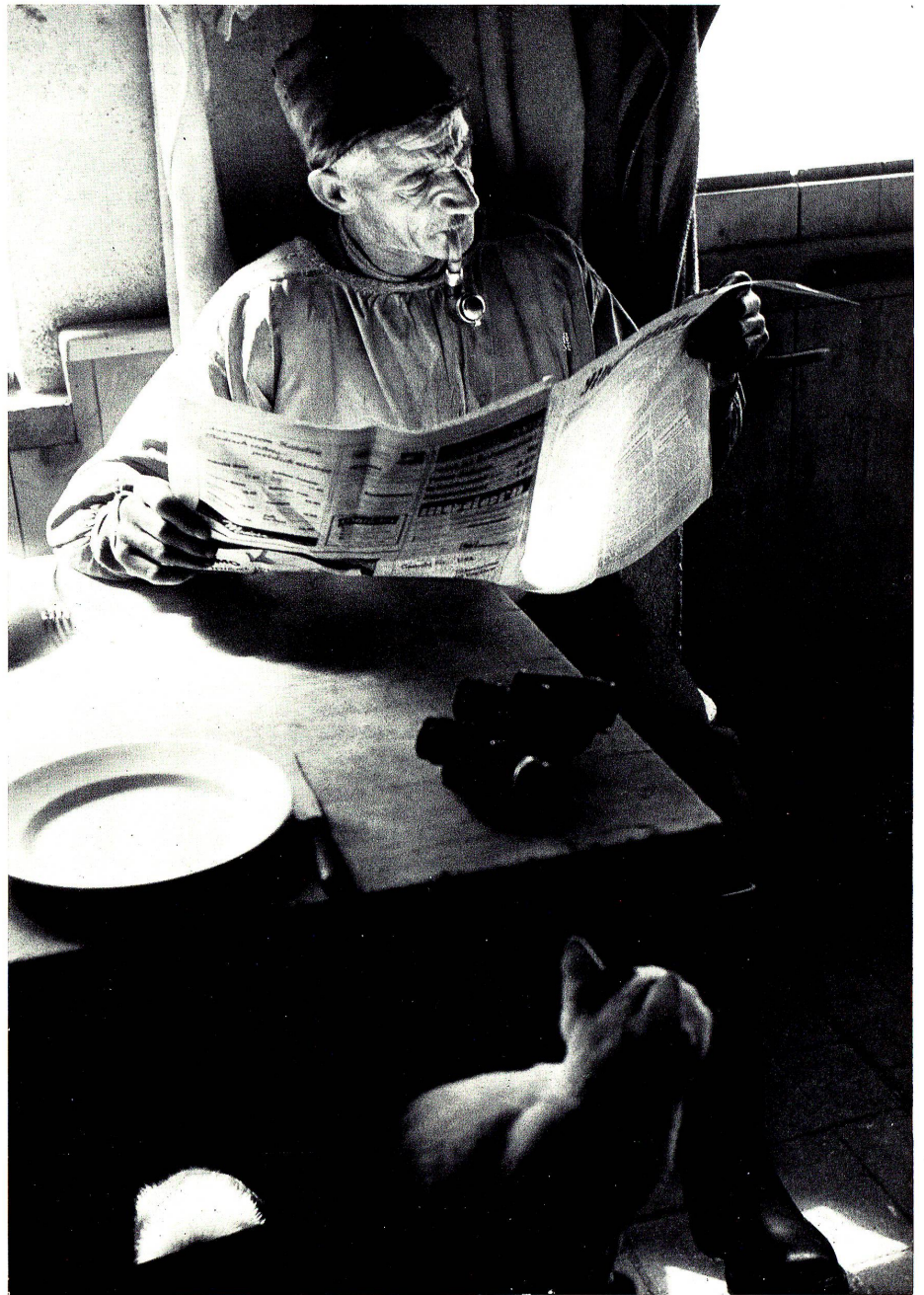
Wiewohl die Bauernsamen nicht einmal mehr den zehnten Teil des Schweizervolkes ausmacht, bildet sie doch eine wesentliche Stütze des Staates. Unser Bild zeigt einen Bergbauern auf der Alp Sardona im Calfeisental.