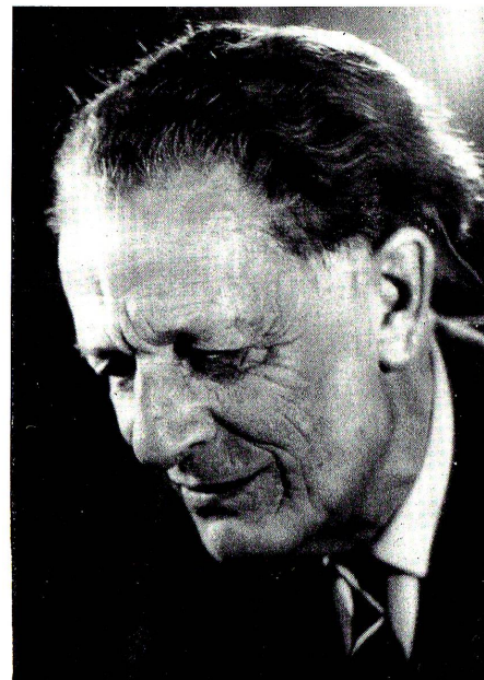
Unter den Schweizer Komponisten unserer Tage steht der 1890 in Genf geborene Frank Martin an erster Stelle; er ist am 21. November 1974 gestorben.

ses Betrages von fast 1,7 Milliarden von der chemischen Industrie und der Maschinenindustrie aufgebracht werden. Natürlich sind das Beträge für exakte Forschungen, von denen man sich einen Nutzen verspricht, wie er sich aus dem Vorsprung in Erkenntnis und technischer Anwendung ergeben kann. Die Grundlagenforschung ist im wesentlichen Sache der Hochschulen und ihrer Institute geblieben.