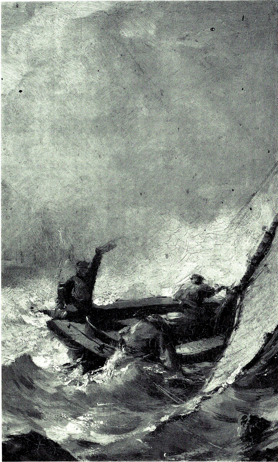
Öl auf Schiefer «Segel im Sturm» von Marinemaler Eugen Zardetti (1849–1926). Besitz Heimatmuseum.