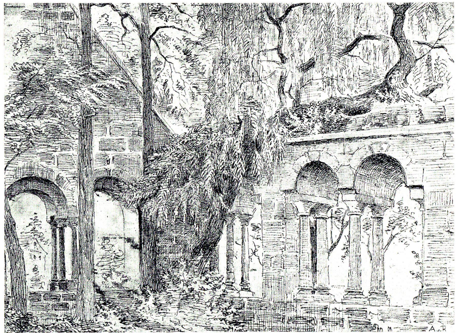
Zeichnung «Überwachener Kreuzgang» von Kunstmaler August v. Bayer (1805–1875), gezeichnet A. B., Besitz Heimatmuseum.

Die Kaufleute, die rücksichtslos ihren Vorteil suchten, bedienten sich üblicher Schliche und unerlaubter Selbsthilfe. So wenn man z. B. das vorgeschriebene Gewicht der Leinwand-Leglen unter «Defraudierung des Zolles und Schiffslohnes in Rheineck» überschritt. Umgehung von Bestimmungen, gelegentliche Verdächtigungen unter den Kaufleuten selbst, ungleiche Behandlung ähnlicher Fälle und Unstimmigkeiten aller Art füllen die obrigkeitlichen Akten jener Jahre des Wohlstandes in der zweiten Hälfte des 18. Jahrhunderts. Doch halten wir fest: von all diesen «hochobrigkeitlichen Beschwerden», die größtenteils im 19. Jahrhundert aufgehoben wurden, lebte die Abtei St.Gallen, die selten Steuern erhob.