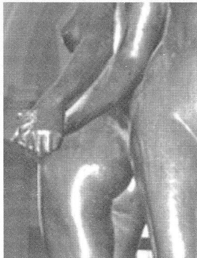
Der Zusammenhalt zwischen den Frauen ist bei männerdominierten Berufsfeldern sehr wichtig

Mit Sicherheit sind fehlende Informationen oder Vorurteile gegenüber den technischen Studiengängen ein grosses Problem. Schuld daran sind auch Unterschiede in der Sozialisation: Weil Jungen im Allgemeinen schon als Kind auf mathematischen