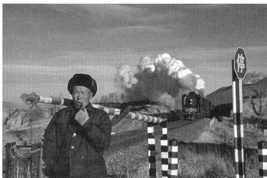
In China ist die Barriere in Männerhand.

Die Wärterinnen waren also sowohl physischem wie auch psychischem Stress ausgesetzt. Die folgende Aussage lässt diese Unruhe erahnen: «Ich möchte an einem Beispiel zeigen, wie ungemütlich die Situation werden kann. Ein Holzfuhrwerk nähert sich dem Übergang. Wie der Übergang passiert