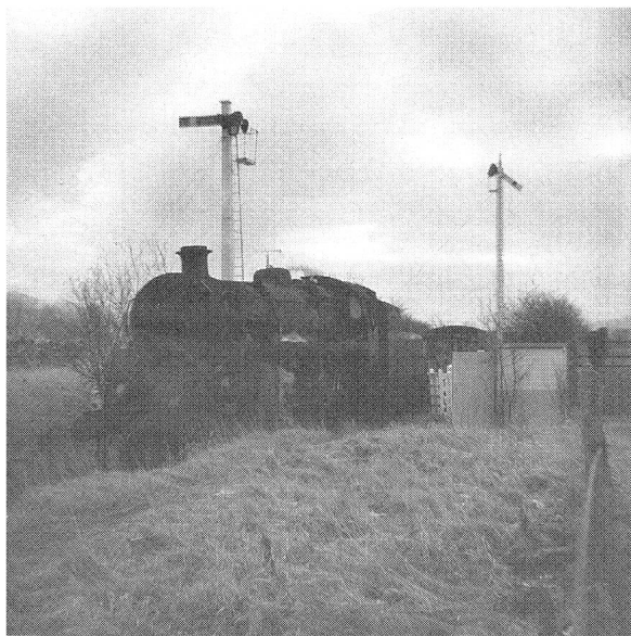
Schrecksekunden, wenn der Zug heranrast.

Die Voraussetzungen für den Kurbel-Vorgang waren in Reglementen und Bedienungsvorschriften