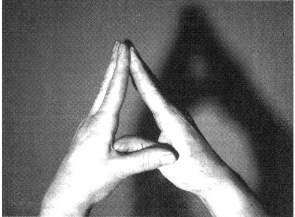
Strukturalistische Sicht: Sprache als Abbild aussersprachlicher Grössen.

liche Handlungen basieren in ihrer interaktiven Funktion auf einer auch sprachlich hergestellten symbolischen Ordnung, die jedoch der sprachlichen Handlung als nicht vorgängig verstanden wird, sondern in dieser immer erst wieder bestätigt