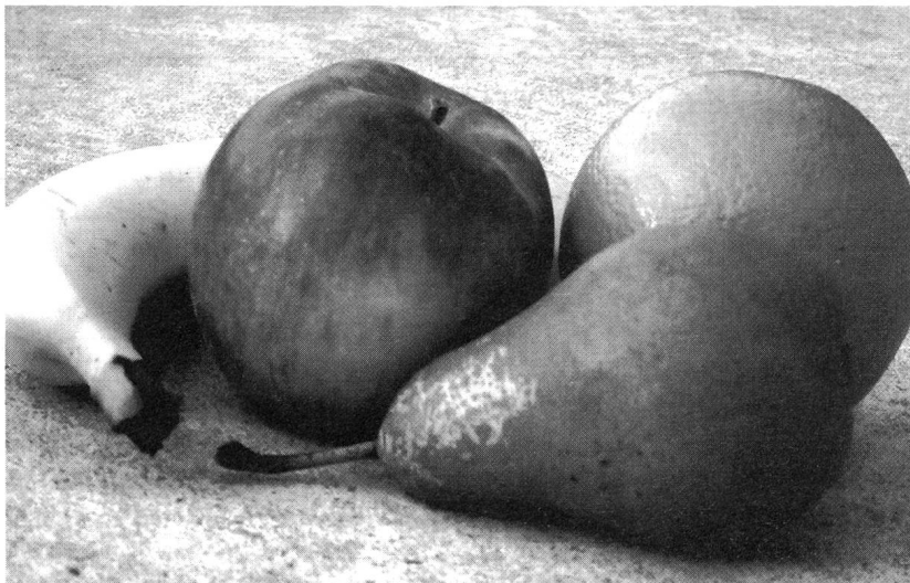
«Le fruit»: Die Frucht ist auf Französisch maskulin – Ein Argument gegen Grimms Grundsatz der Genuszuweisung.

Die Sichtweise, dass Gender sprachlich zum Ausdruck kommt, ist auch der Ausgangspunkt desjenigen Teils der so genannten Feministischen Linguistik, der sich mit Sexismus in der Sprache seit den 70er-Jahren des 20. Jahrhunderts in verschiedenen westeuropäischen Ländern und den U.S.A. beschäftigt hat. In einem zweiten Schritt folgt aus der Kritik die Forderung nach einer systematischen