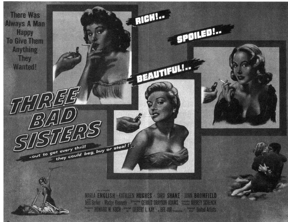
Fundstück: Three Bad Sisters (1956)