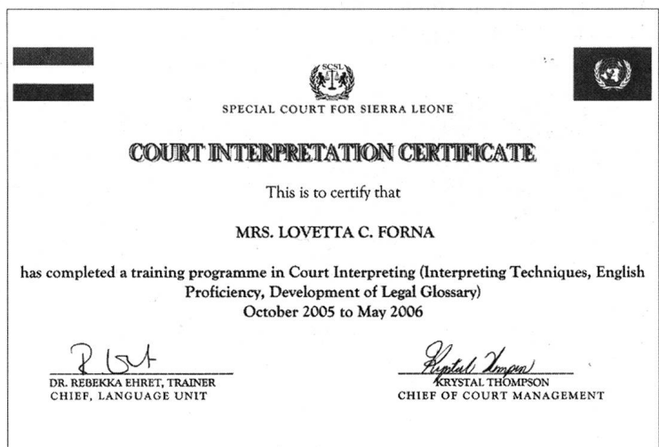
Das Zertifikat für die ÜbersetzerInnen am Special Court.

Es ging im Grossen und Ganzen darum, die weiblichen und männlichen Stimmen zu vertreten und damit ein Geschlechterbewusstsein aufzubauen. Ziel war es, dass auch weibliche Stimmen mit dem Gericht in Verbindung gebracht werden. Es gab ja auch Radiomitschnitte der Gerichtsverhandlungen, die ausgestrahlt wurden. Und da sollte man eben auch weibliche Stimmen hören. Ausserdem wurden Videozusammenschnitte des Sondergerichtshofs in den Dörfern gezeigt. Da habe ich auch geschaut, dass weibliche Stimmen von weiblichen Dolmetscherinnen gesprochen werden. Es ging mir wirklich darum, dieses Geschlechterbewusstsein