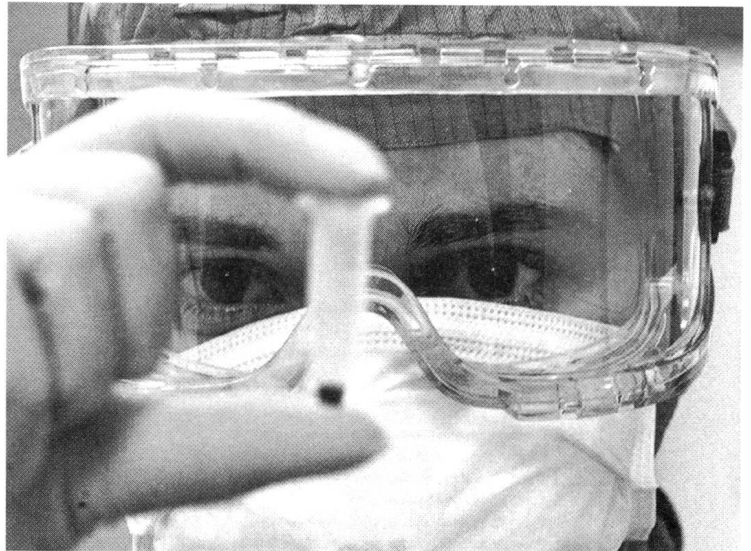
Den Erreger im Blick

Von zentraler Bedeutung für den biopolitischen Diskurs über die neuen Infektionskrankheiten ist zunächst ein moralisch geprägtes Verständnis der destruktiven Auswirkungen grenzenloser Modernisierung . Eine immer wiederkehrende Aussage im Diskurs der neuen Infektionskrankheiten betrifft die begründete Annahme, dass massive Eingriffe in fragile Ökosysteme neue Kontaktzonen zwischen Mensch und Tier geschaffen haben, die zur Ausbreitung von seltenen Krankheiten wie dem Riftalfieber geführt haben. Wenn der Lebensraum von Moskitos durch den Bau von gewaltigen Dämmen vergrössert wird, kommen neue Populationen in Kontakt mit neuen Erregern. In diesem Kontext werden auch moderne Lebensformen, Geschlechterverhältnisse und Sexualpraktiken als