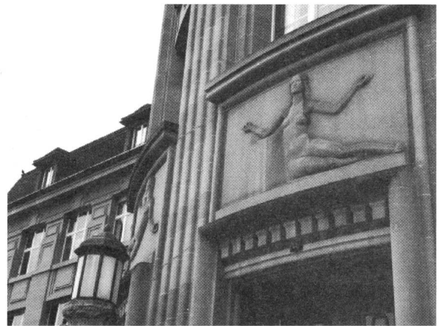
Die universitäre Geschlechterfrage

Woran liegt es, dass die Gender-Theorie kein Gehör hat für die Zusammenhänge zwischen dem