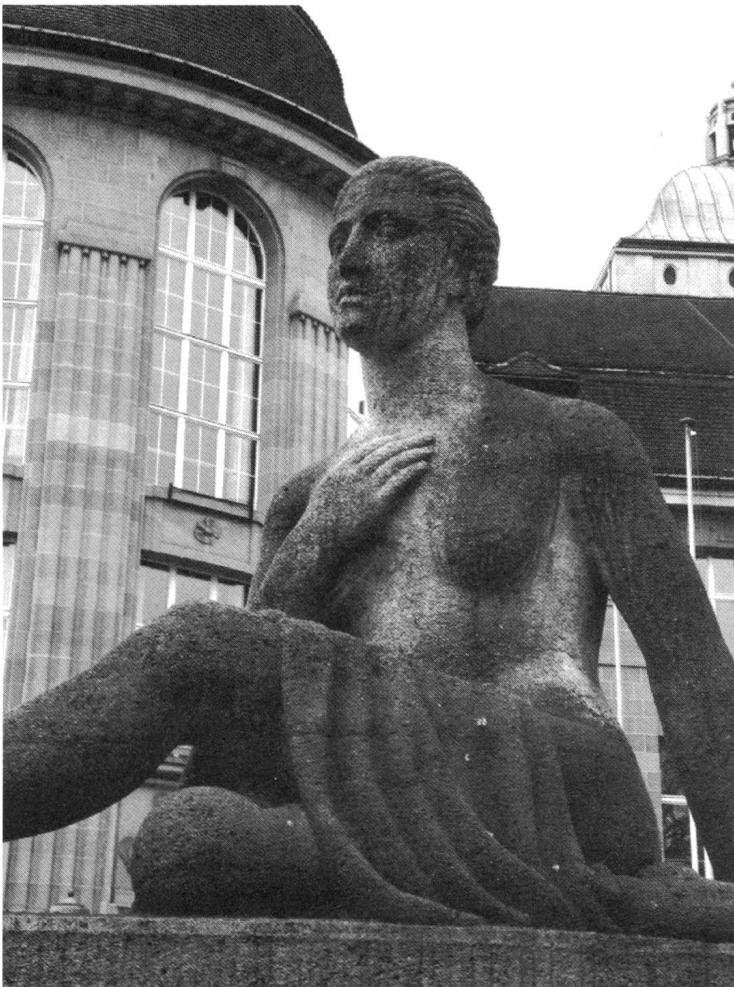
Geschlecht als kollektive Neurose?

Spätestens seit ich als junge Germanistik-Studentin in den 80er-Jahren praktisch zeitgleich an einem Seminar zu Sigmund Freuds Traumdeutung und an einem Seminar zur feministischen Literaturwissenschaft teilnahm, war ich «angefixt»