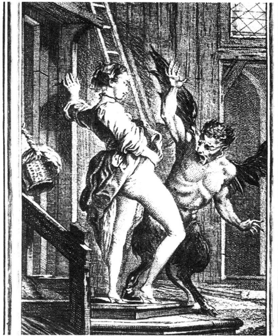
Der Dämon erschrickt ob der entblößten Scham.

Wie kann es sein, dass die von der Gesellschaft zu Schamhaftigkeit gezwungenen Frauen, die