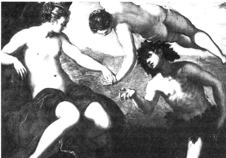
Venus und Bacchus mit Nietzsches idealer Frau - Ariadne.

Mit dem Begriff der Scham führt Nietzsche in der fröhlichen Wissenschaft ein zentrales Argumentationsmotiv im Bezug auf die Wahrheit an: «Wir glauben nicht mehr daran, dass Wahrheit noch Wahrheit bleibt, wenn man ihr den Schleier abzieht; [...]» 2 . Der Text stellt also einen Wahrheitsbegriff auf, der sich nicht aus etwas über ihm liegenden herauschälen lässt, vielmehr liegt die Wahrheit auf der Oberfläche, da sie sich verändert, unwahrer wird, sobald Versuche unternommen werden, ihr auf den Grund zu gehen. Diese Idee einer Wahrheit der Oberfläche wird in der Vorrede nicht nur über das Kleidungsstück des Schleiers mit Weiblichkeit verknüpft, sondern zusätzlich mit einer Parabel erläutert: «Ist es wahr, dass der liebe Gott überall zugegen ist?» fragte ein kleines Mädchen seine Mutter: «aber ich finde das unanständig» — ein Wink für Philosophen! Man sollte die Scham besser in Ehren halten, mit der sich die Natur hinter Räthsel und bunte Ungewissheiten versteckt hat.» So sollen die Philosophen also wie ein weibliches Kind denken: Die Scham ernstnehmen und sich an die Oberfläche halten. Auch im ersten Teil des zweiten Buches, wo sich die berühmtesten Frauen-Aphorismen befinden, wird die Scham mehrfach thematisiert. Es wird also den Frauen aufgrund ihrer gesellschaftlichen (Ideal?-)Rolle eine spezielle Einsicht in die Wahrheit zugesprochen, indem beispiels-