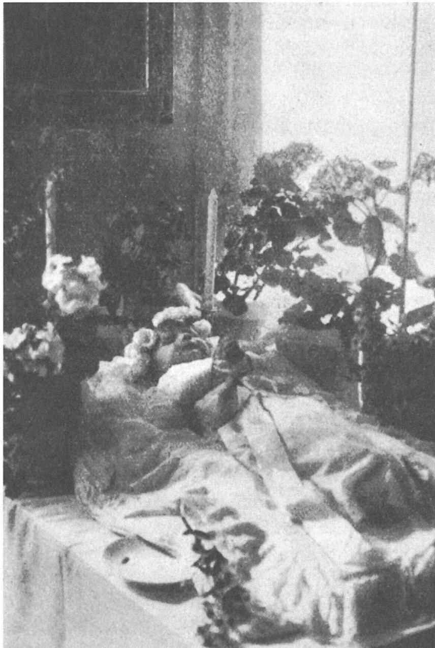
Dardin. Baret vestgius en e mess en bara, ornaus cun fluras, tshupi e tenend mauns da ludaus.

caussa purmein de famiglia e dils registers civils. Las funcziuns de baselgia ein buca zugliadas viaden pli els vegls e bials usits de vischnaunca e de parentella sco avon tschentaners. Era els pigns uclauns de valladas muntagnardas para il suffel modern de scavigliar empau alla gada igl uorden vegl, mo per ventira dat ei aunc bia bialas restonzas che vegnan admiradas dils jasters e della scienza.