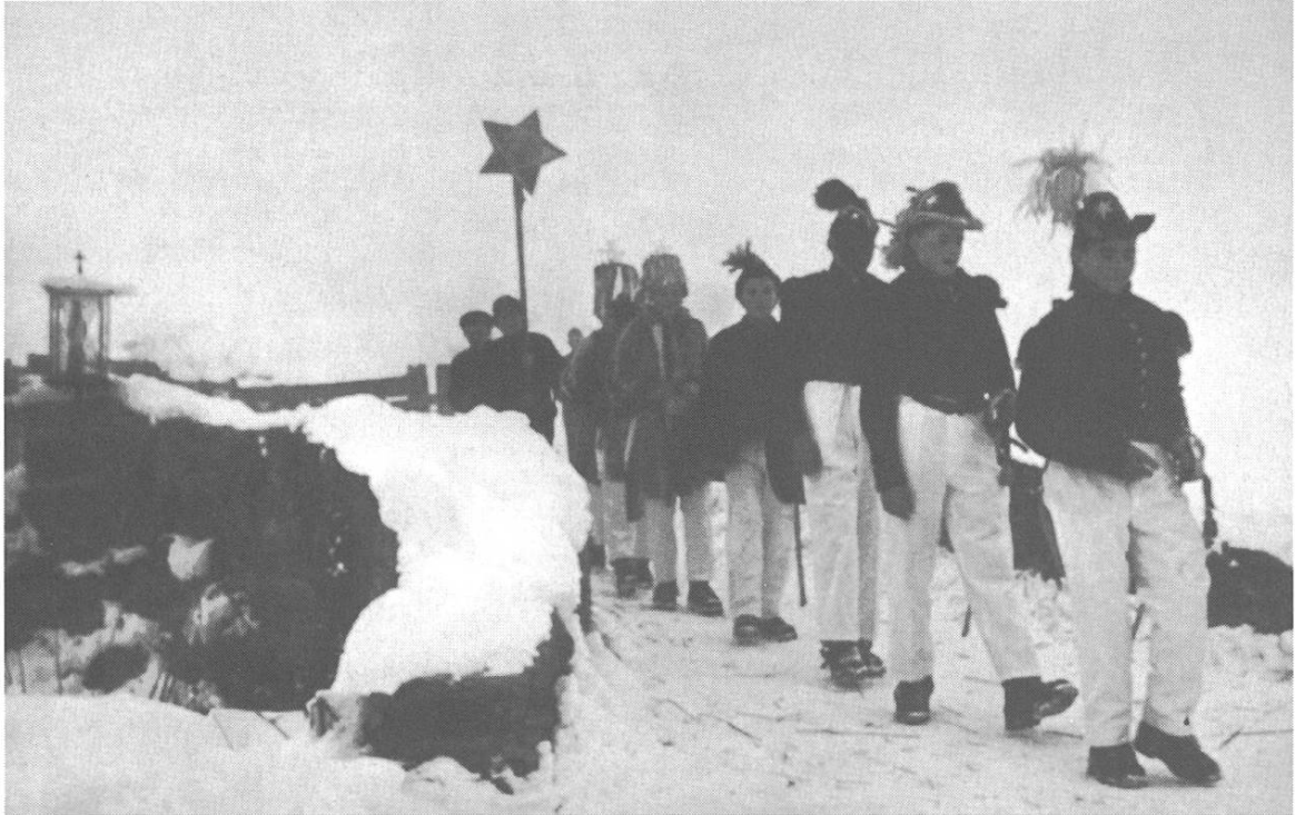
Breil. La gruppа regala de nov dels che passa gest la punt veglia dil Flem, fa ina remarcabla comparsa. Alla testa il capitani, lura siu servitur, epi il retg ner e servitur, suondan ils retgs de pindels, il steiler, ed il davos il catschats.

Quei temps concediu munglass buc vegnir tuccaus e taccaus entras novs uordens de scola. Quei cuoz extraordinari ei in factur de vitalitad sco era quel digl astgar munchentar la scola quels 3 gis. Co ein egl avegnir quels 2 facturs positivs de salvar? Sin nies territori romontsch demuossa gronda vitalitad ed independenza la moda, culla quala ils retgs s'organiseschan ent-eifer il spazi de certs dretgs sviluppai ed artai. La tradiziun pli veglia cun retgs carschi ha saviu sesviluppar e serecuvrar stupent silla basa dil sistem scolastic dils davos 150 onns. A nus para igl usit leu il pli verdeivel e statteivel nua ch'ils scolars camondan las fiastas, nua che ils carschi diregian pauc ni cun adatg e schanetg, nua ch'il recav auda en principi als retgs sezs e per il manteniment de vestgadira, steilas e requisits. Ils dretgs existents astgan mo vegnir taccai sche las relaziuns, novas situaziuns pretendan categoricamein, mo mai, sch'il cunfar digl usit duess cunterfar ad instituziuns civilisatorias moder-