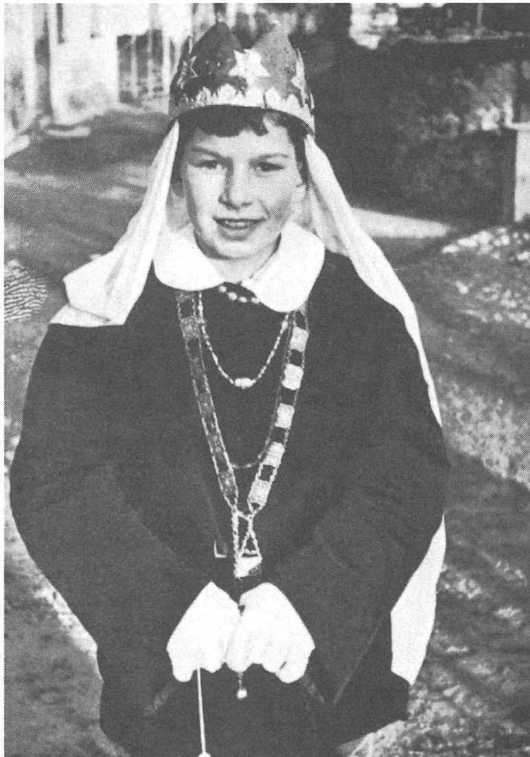
Domat. In dils treis sogns retgs a Domat. In sim- patic buobet che ri sut la cruna ed ils ornaments neuado!

sper il Jura Bernes ed il Tessin, va frestgamein culla steila! Au- tras cuntradas ein vitas, la Svizra franzosa ed auters tschancuns ein surtratgs cun tut differentes svilups dil medem patratg dils retgs digl Orient. Sche nus mein in tschancun pli lunsch, ob- servein nus nies usit dapi forsa 600 onns enneu en Tiaratu- destga, ell'Ungaria, en Croazia e Slovenia ed en tuttas tiaras de schierm e de cultura cristiana, cun preferenza las tiaras de tra- diziun catolica, era quellas en auters continents, derivontas en sia populaziun e lungatg dal vegl ravugl europeic, sco per ex- empel Mexico, l'America dil sid etc.