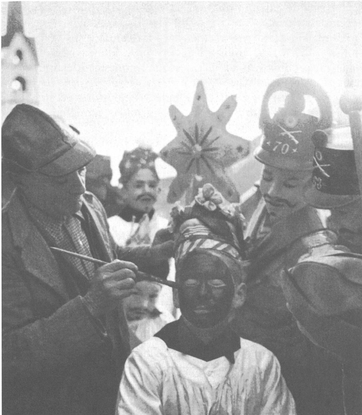
Alvagni. Cun tgei concentraziun ed interess che il retg ner, il Mor, vegn pennellaus dal pictur dil vitg, e cun tgei pazienza ch'el lai tractar cul barschun de color entuorn egls e sin fatscha.