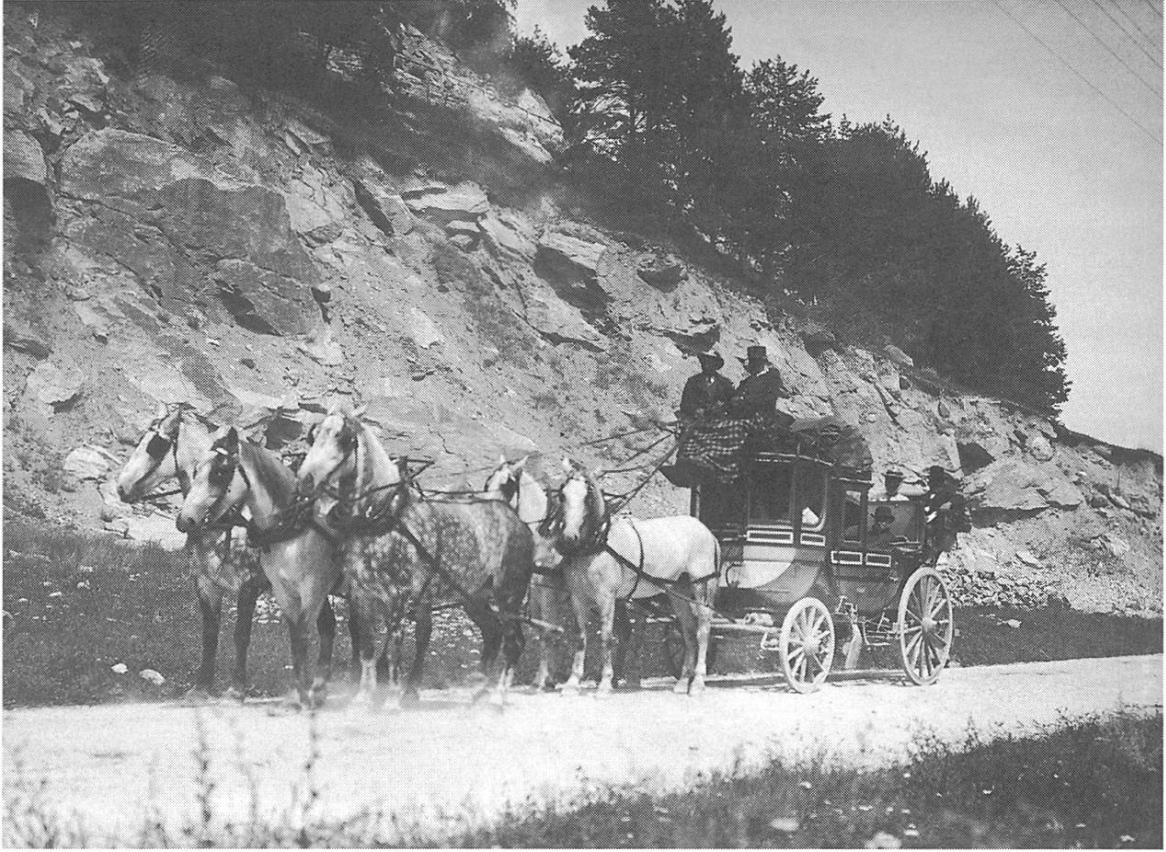
Posta de 5 cavals dil cuolm d'Ursera, fenadur 1906. Per ils students eran cuosts de posta buca de redember!

Vus saveis, ussa sensanflet puspei cuntents e ventireivels e de buna luna enamiez mes cudischs. Buca savens ha ei ils em-prems 8 dis semegliau aschi liung ed en consequenza de quei fatg sesentius schi solitaris sco uonn.