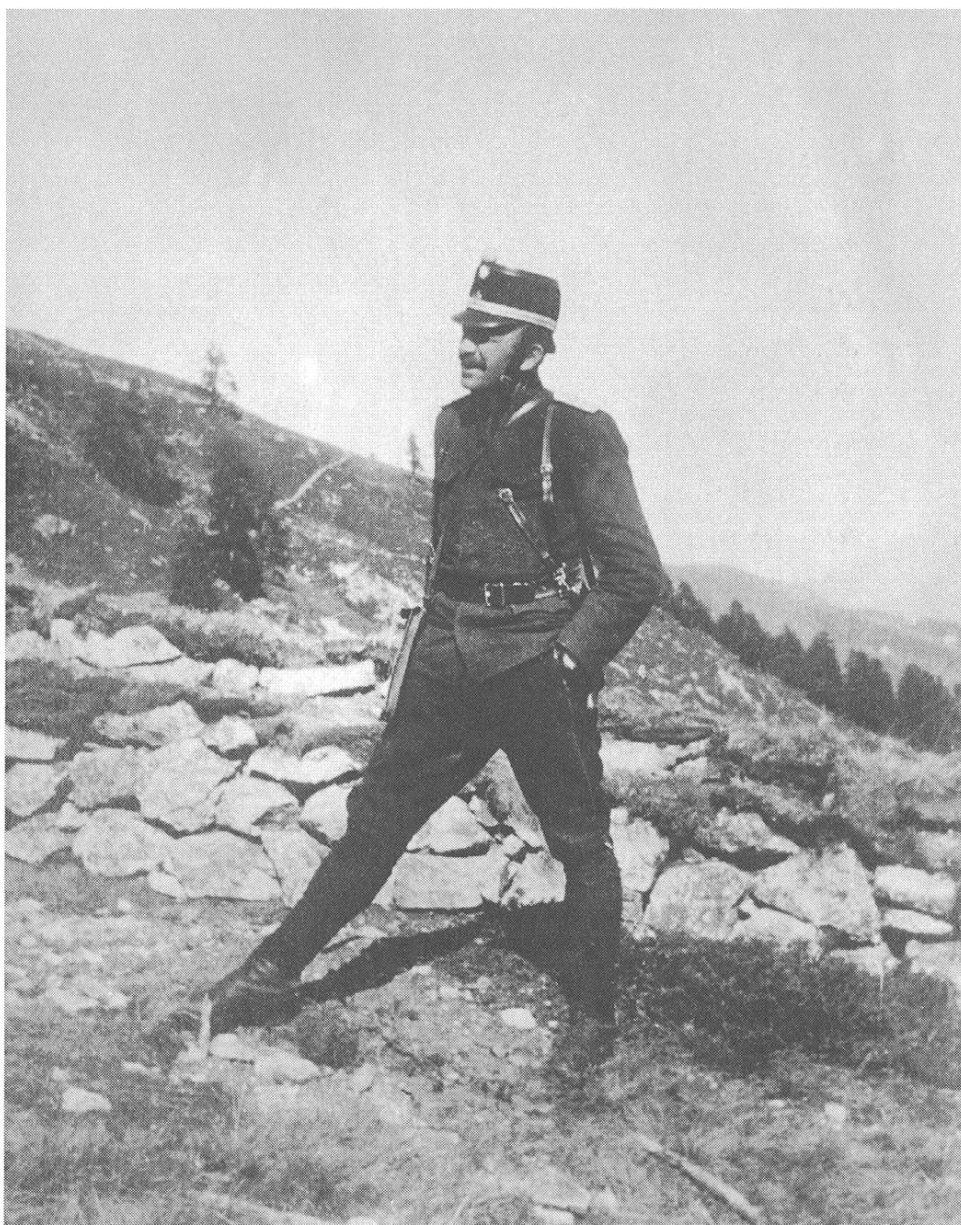
Colonel Toni Mudest Cahannes 1869–1952. Maletg fatgs ell'Engiadina durant l'occupaziun militar 1914–1918.

spetgau schi vess silla fin sco uonn. La filosofia pren neu tut autr'uisa che fahs humanistics. Il davos meins fuvel enqualga tuttavia buca bein en gamba. Ina curiosa malenconia, mal e grevadetgna dil tgau la dameun marvegl. Quei era tuttavia buc ina buna disposiziun per studegiar. Ussa va ei meglier e l'approximonta vacanza vegn schon a leventar il humor e la forza. Hai dapresent in ni dus examens ed ina discussiun avon mei.