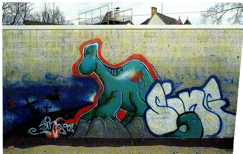
«Verzierte» Betonwand – Aktion gegen graue Wände

gar so schlimm gekommen war, wie man pessimistischerweise budgetiert hatte. Das Defizit fiel mit 5,1 Mio. Franken wesentlich kleiner aus als erwartet. Vor allem die Grundstücksgewinnsteuer und die Steuern der juristischen Personen brachten unerwartete Mehreinnahmen. Schliesslich brachte die Aufarbeitung von Pendenzen definitiver Veranlagungen bei den Einkommens- und Vermögenssteuern zusätzliche 2,1 Mio. ein. Solchen Erfolgsmeldungen zum Trotz musste eine Neuverschuldung von 14,7 Mio. auf die Rekordmarke von nunmehr 136,4 Mio. Franken zur Kenntnis genommen werden. Das bedeutet umgerechnet eine Schuld von 1637 Franken pro Kopf. Trotz diversen Sparanstrengungen mussten teils massiv gestiegene Ausgaben verbucht werden. Vor allem die Fürsorgeleistungen machten mit 19,1 Mio. Franken (plus 3,4 Mio. gegenüber dem Vorjahr) einen deutlichen Schritt nach vorne. Angesichts der anhaltenden Rezession und der durch sie bedingten Härten sind hier kaum Einsparungen zu realisieren. Im diesjährigen Geschäftsbericht stellte das Finanzamt Vergleiche zwischen den Ausgaben der Stadt und anderer Gemeinden an und kam dabei zum Schluss, dass nach Abzug der Aufwendungen für zentralörtliche Dienste (Stadtpolizei, Feuerwehr, höhere Schulen, Verkehrsbetriebe und Kulturinstitute) keine signifikanten Unterschiede festgestellt werden können.