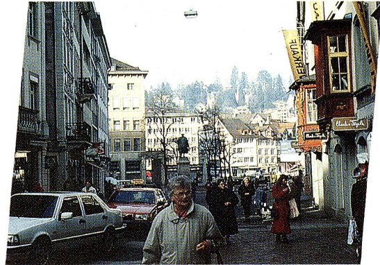
Fussgänger, Automobilisten, Anwohner – die künftige Verkehrsentwicklung lässt keinen kalt.