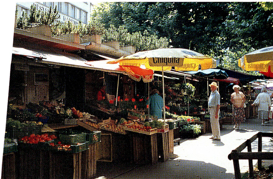
Einkaufsparadies St.Gallen: Marktasse (oben) und Marktplatz.