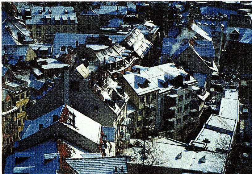
75 Jahre «Gross-St. Gallen» – Grund zum Feiern und Nachdenken.