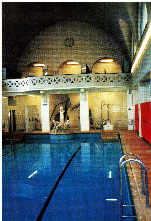
Bei der Renovation des heute noch von 35'000 Personen besuchten Volksbades soll der Jugendstilcharakter erhalten und das Bad mit Angeboten aus dem Gesundheitsbereich mit neuem Leben erfüllt werden.