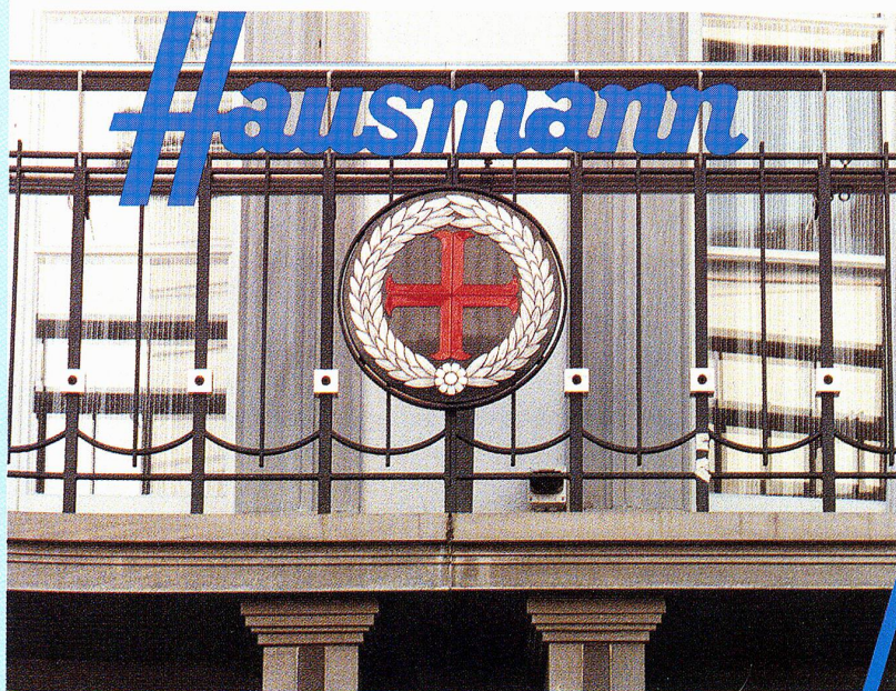
Das Signet des alten Heiliggeist-Spitals am Hause Marktgasse 11, das von 1228 bis 1845 zum Stadtspital gehörte.

Die Firmen sind in der Hausmann Holding AG zusammengefasst und werden massgeblich von der Familie des Gründers geleitet.