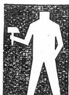
Fédérations confessionnelles et jaunes

Chacune des figures représente 20,000 ouvriers organisés. Les huit figures noires représentent les ouvriers, employés et fonctionnaires organisés dans l'Union syndicale suisse.