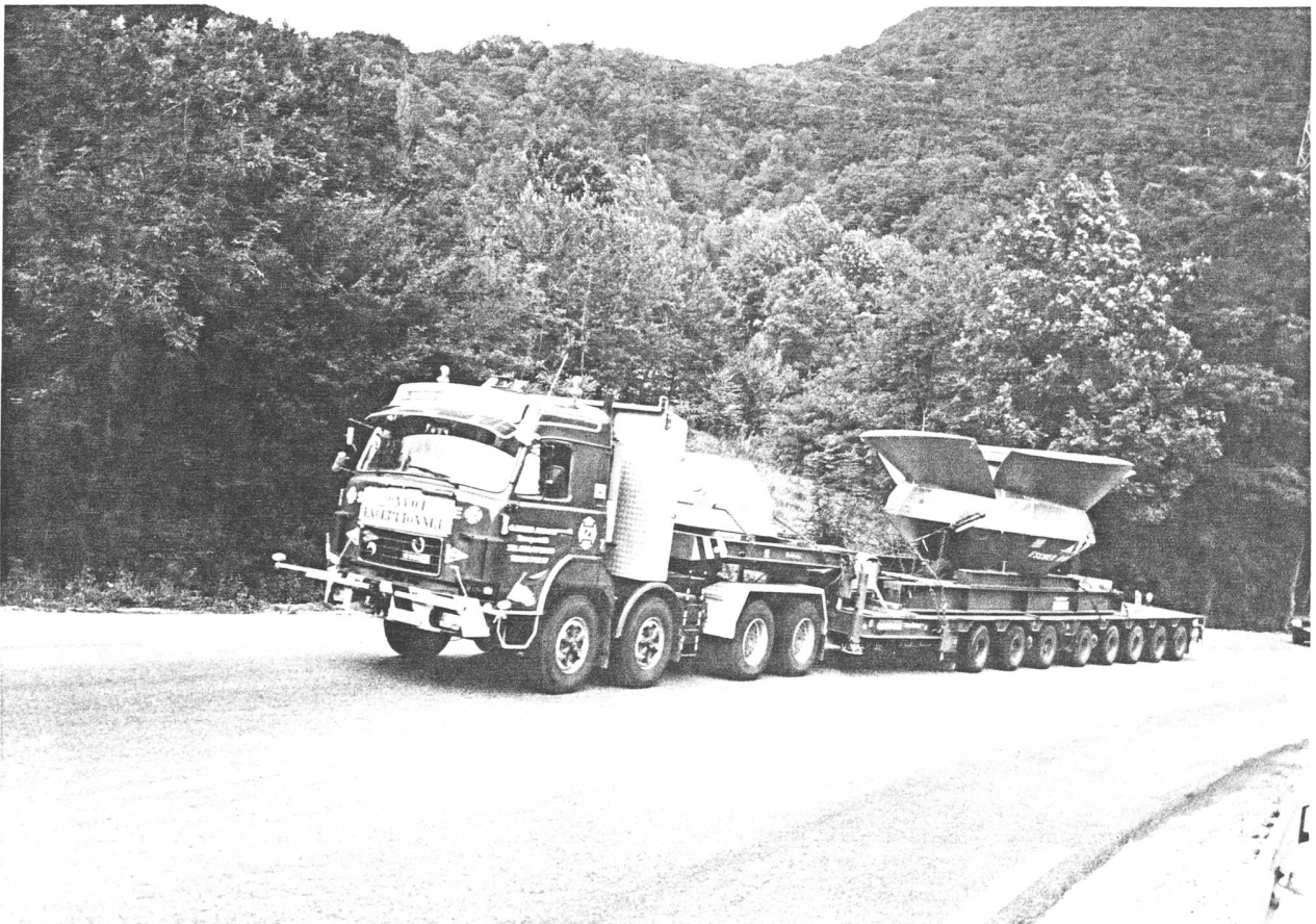
Einer der Transporte von Otto Zuber, unterwegs nach Barcelona.