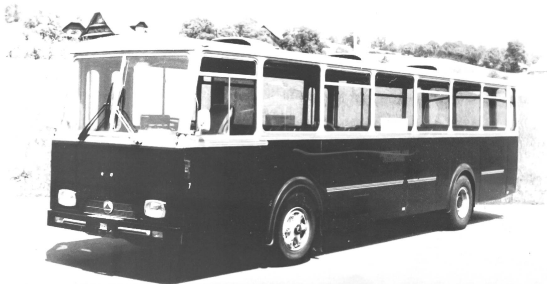
Bild unten: Saurer 5 DUK D1KU Bauj.1972.Carrosserie Hess. Wagen Nr.7 der Rottal Auto AG