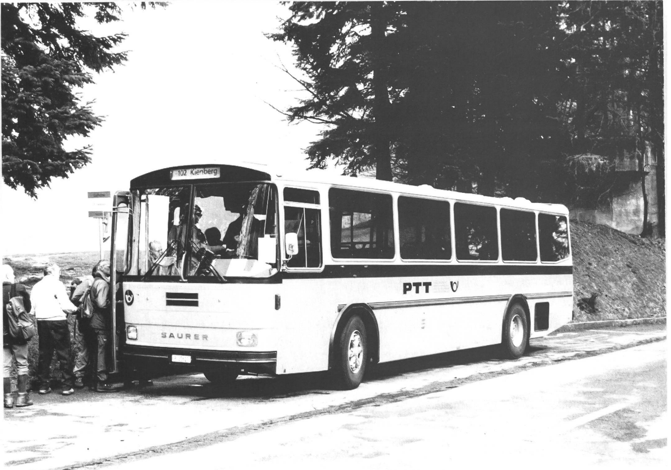
Bild oben: Saurer RH 580-25 D3KTU-B Bauj.1982 P-25820 Carrosserie Tüscher