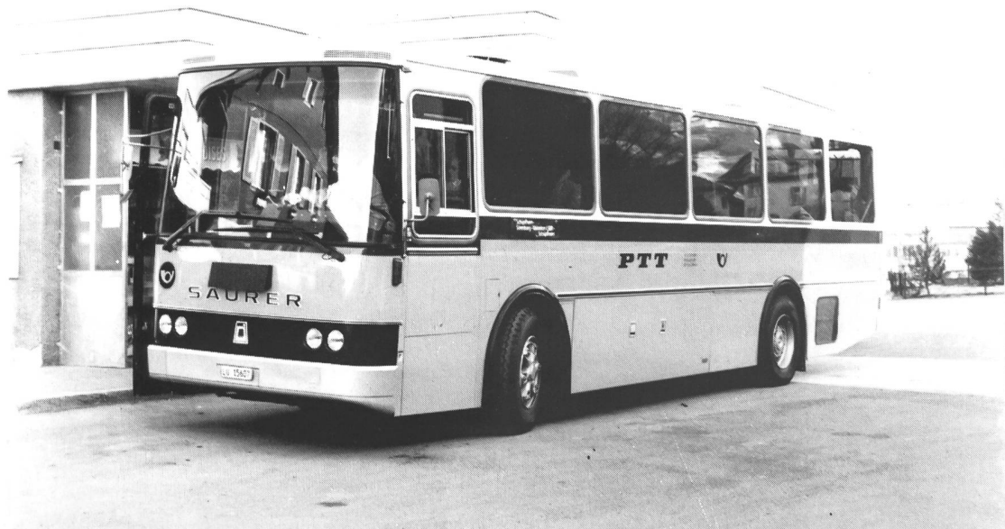
Bild unten: Saurer RH 525-23 D3KTU-B Bauj.1982 Carrosserie Ramseier/Jenzer. PAH A.Schnider, Schüpfheim