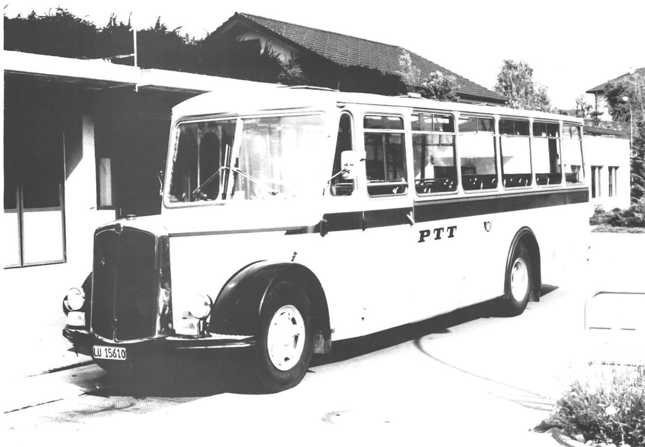
Bild oben: Saurer L4C CT2D Bauj.1965.Carrosserie Ramseier/Jenzer. PAH Sidler Sempach-Stadt