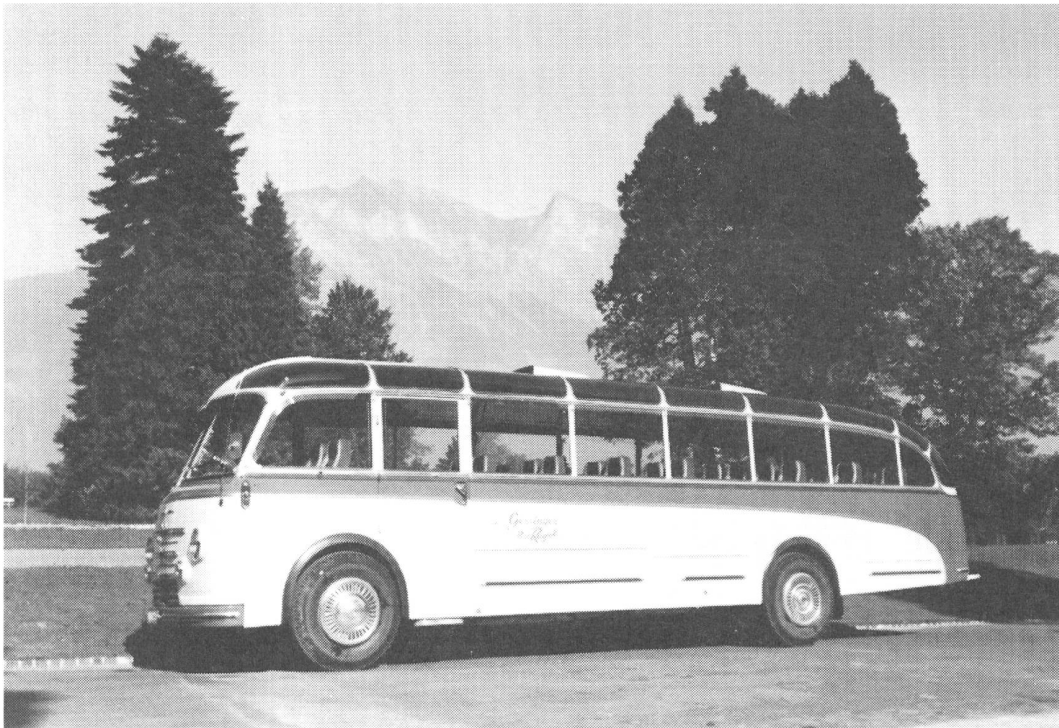
1. Reisewagen 1957