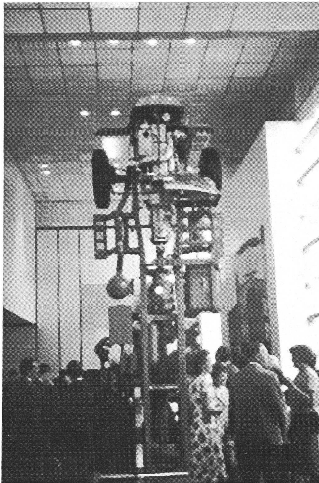
Saurer 5DM an der Landesausstellung 1964 in Lausanne

La qualité de notre production est notre meilleur atout pour son écoule- ment. Un produit de qualité, symbo- lisé par ce moteur Diesel, a exigé les meilleures forces d'une équipe de savants, de fabricants, d'ingénieurs, de techniciens, d'employés, de contre- maîtres et d'ouvriers. Plus que jamais, la paix dans le travail est la condition absolue de notre existence à nous tous.