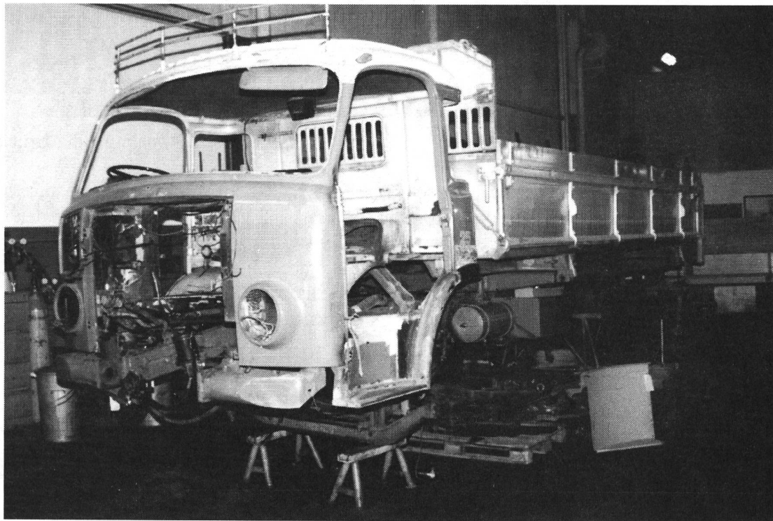
Berna 5VF in Arbeit

In der letzten Gazette habe ich geschrieben, dass wir Sponsoren für einen Berna 5VF Kipper suchen. Angeschrieben worden sind Firmen, die als Zulieferer, Servicestelle oder Kunde mit Saurer in Verbindung waren, grössere Firmen in der Umgebung von Arbon und grosse Unternehmungen die in der ganzen Schweiz bekannt sind, wie Banken, Versicherungen,... Angaben zu den Sponsoren findet Ihr weiter hinten. Die Beiträge ergeben noch keine Fr. 30'000.-, da aber der Spendeneingang recht erfreulich aussieht und sicher noch die einen oder anderen Beiträge eingehen werden, haben wir die Instandstellung gestartet.