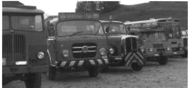
Eine herrliche Oldtimerparade! (Mittagspause in Disentis)

eigentlich berichten? Am besten ist wie meist: lasst Bilder sprechen!