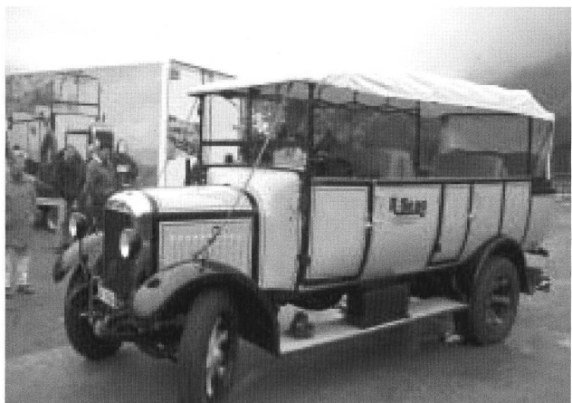
Unbestrittener Star der Ausfahrt: Röllins mit ihrem FBW-Gesellschaftswagen – standesgemäss im eigenen Trailer angereist!