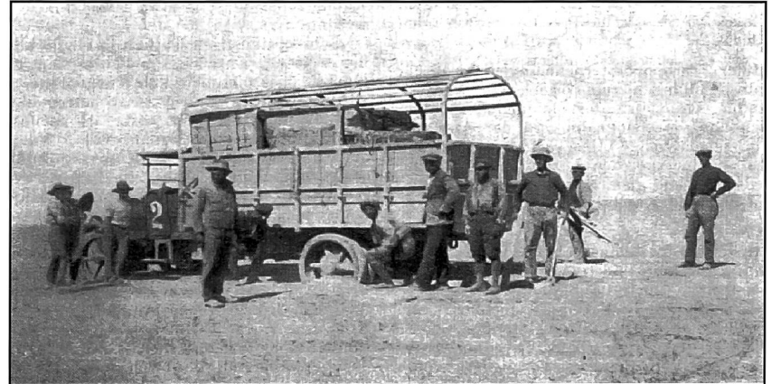
Im Flugsand der Wüste zwischen Ramadi und Faluja

schaft ausführen. Wir versorgten uns nochmals mit allem Nötigen und fuhren bereits um 20.00 Uhr wieder ab. Nun begann die Wüstenfahrt über eine Entfernung von 205 Meilen bis Ramadi, wo wir am 7. Juni, um 18.00 Uhr, ankamen. Normalerweise hätte hier die Wüstenfahrt ihr Ende erreicht, da Bagdad, das 75 Meilen entfernt liegt, in 4 bis 5 Stunden erreicht werden kann. Durch die Überschwemmung des Euphrat war aber die Strasse und ein Gebiet von 50 Meilen vollständig überschwemmt, so dass der Umweg durch die „Harpana“, eine Wüste mit tiefem Flugsand, gewählt werden musste. Hier begannen die Leiden, von denen wir Fahrer allerdings mehr als die Wagen betroffen waren. Nach reichlicher Überlegung demontierten wir die Anhänger und verladen die Einzelteile auf die Zugwagen. Diese Lösung bewährte sich, denn mit den Anhängern wären wir nie durch den tiefen Sand gekommen. Mit 5 bis 5,5 Tonnen Belastung auf jedem Wagen begann am 8. Juni die Fahrt in Richtung Talusa (in die Gegend des frühen Babylon). Am ersten Tag machten wir unter grossen Anstrengungen 24 Meilen, am zweiten Tag stiegen die Anforderungen ausserordentlich, und wir brachten nur noch 9 Meilen hinter uns, am dritten Tag kamen wir sogar nur eine Meile vorwärts, und erst am vierten Tag erreichten wir Talusa, die Maschinen tadellos, die Mannschaft mehr tot als lebendig. Vier Tage waren nötig, um 90 Meilen zurückzulegen. Nun waren die