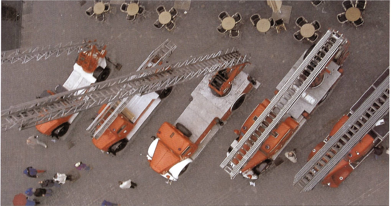
Drehleiter-Parade aus der Vogelperspektive (Foto Peter Rohrer, von der Spitze der 30m-Leiter der OCS- 2DM-ADL „Fw Herisau“ aus fotografiert)