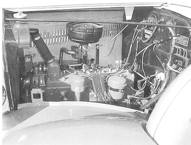
Bild rechts: Der wunderschöne gepflegte 2.7l 6 Zylinder Benziner, ein richtiger „Amerikaner“, montiert in der Schweiz.

Der heute etwa 80 Jahre alte, langjährige Vorbesitzer dieses Cabriolets könnte einem neuen Eigentümer über die Vorgeschichte dieses Bijous Einiges erzählen.