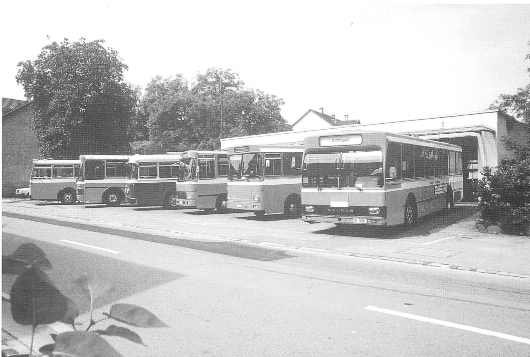
Die flotte Flotte der AOT. Wo ist „unser“ SH-Bus?