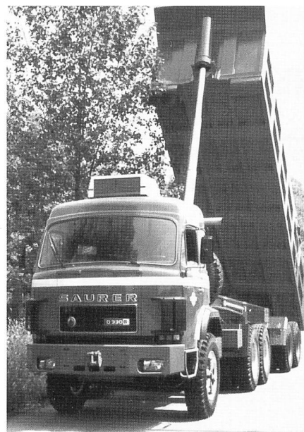
Saurer im Einsatz auf einer Baustelle im Irak