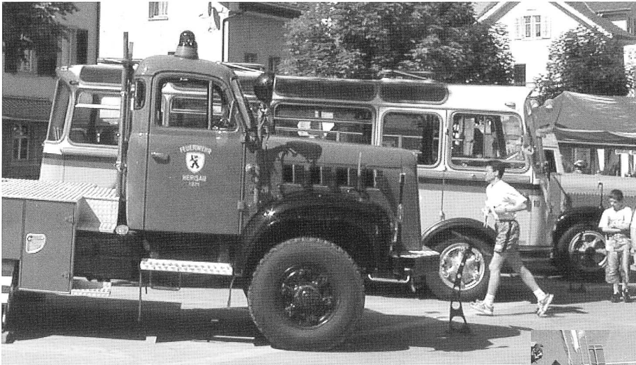
OCS-Fahrzeugparade mit Drehleiter Herisau, SV2C-Postauto, Schützengarten BLD, und ganz im Hintergrund Shell-Schlepper