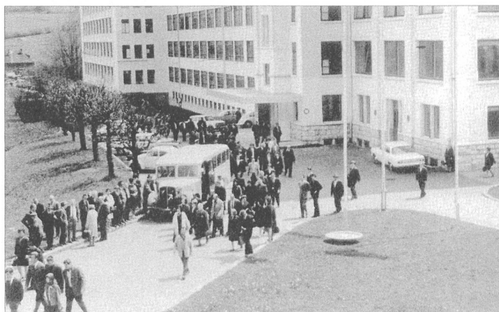
Mai 1967: Feierabend bei Longines in St-Imier. Die Fabrikarbeiter wurden vom werkseigenen Saurer-Autocar nach Hause gebracht

beiter aus der Umgebung zur Arbeit reisten. Archivator Frédéric Donzé mag sich auch erinnern, dass der Bus noch in den späten 1960er Jahren in Betrieb stand: «Der Bus hatte einen festen Fahrplan, mit dem die verstreuten Jura-Dörfer angefahren wurden.» Donzé, welcher als Uhren-Kenner auch das Longines-Museum betreut, meinte während unseres Besuchs: «Weltberühmt wurde Longines durch die Zeitmessung bei Sportanlässen. Bereits 1896 wurden Longines Chronographen an den olympischen Spielen in Athen eingesetzt.» In den 1950er und 1960er Jahren verwendete u.a. der britische Rennbootfahrer Donald Campbell für die Fahrten mit seinem Gasturbinen-Boot «Bluebell» die von Longines