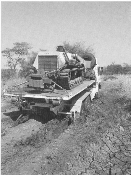
Mit Saurer steckengeblieben