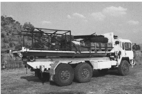
Rücktransport 2. Fahrt

Am nächsten Tag begannen Paulino und ich, unseren 20“-Container auszuräumen. Wir beluden die Abrollbrücke des Saurer von Hand und brauchten dafür einen Tag. Zu unserem Material kamen noch Gestelle für die Wassertanks des Camps, die ebenfalls nach Damazin zurück gebracht werden mussten.