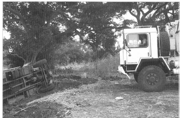
Aufstellen des umgekippten LKWs

Nach einer Weile abenteuerlicher Fahrt sahen wir plötzlich einen Traktor mitten auf der Piste. Beim Näherkommen entdeckten wir, dass er erfolglos versuchte, einen umgekippten Lastwagen wieder auf die Räder zu stellen. Wir zögerten nicht lange und hielten an. Mit einer Kette, die wir am Aufbau dieses Oldti-