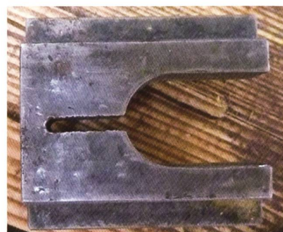
Spannbacke zu Düsenmontage