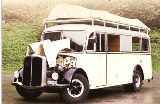
Frisch restauriert, Bühne auf dem Dach, Sound-Ausrüstung (optional)