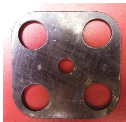
Vorrichtung zu Ventilausbau