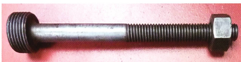
Gewindebolzen zu Ventilausbau

Mail: maxzingg@gmx.net Tel. 071 223 57 10 Mobile: 079 600 61 31