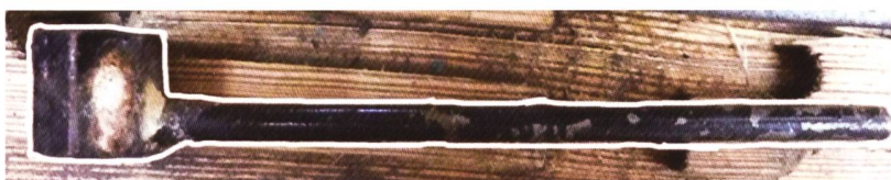
12er Steckschlüssel mit Griff