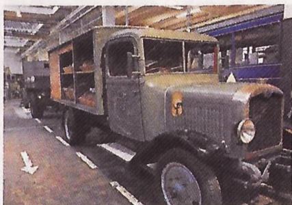
Das Bäckereiwägeli vom Typ 2B steht seit Montag im Saurer Museum Arbon

zum Leben, so dass die Vergangenheit ihre Geschichte erzählen kann», verspricht Baer. Gut ein halbes Jahr seien die Backwaren im Museum haltbar, ehe «frISCHE» Fünfpfünder in die Theken des Oldtimers geladen werden. «Bereits jetzt wurden durch die Brote bei vielen Besuchern Erinnerungen an frühere Zeiten geweckt», freut sich Baer. Mit dem «Bäckereiwägeli» nähert sich die Saurer-Sammlung weiter der Vollständigkeit. «Es gibt aber schon noch zwei, drei Modelle, die wir gerne im Saurer-Museum zeigen würden», sagt Baer. Nur: Mittlerweile nähert sich das Museum erneut der Kapazitätsgrenze.