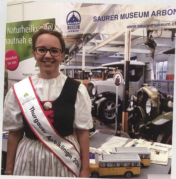
Tourismus-Pop-up-Messe am 2. März 2019 in Weinfelden: Die Thurgauer Apfelkönigin beehrt uns mit einem Besuch