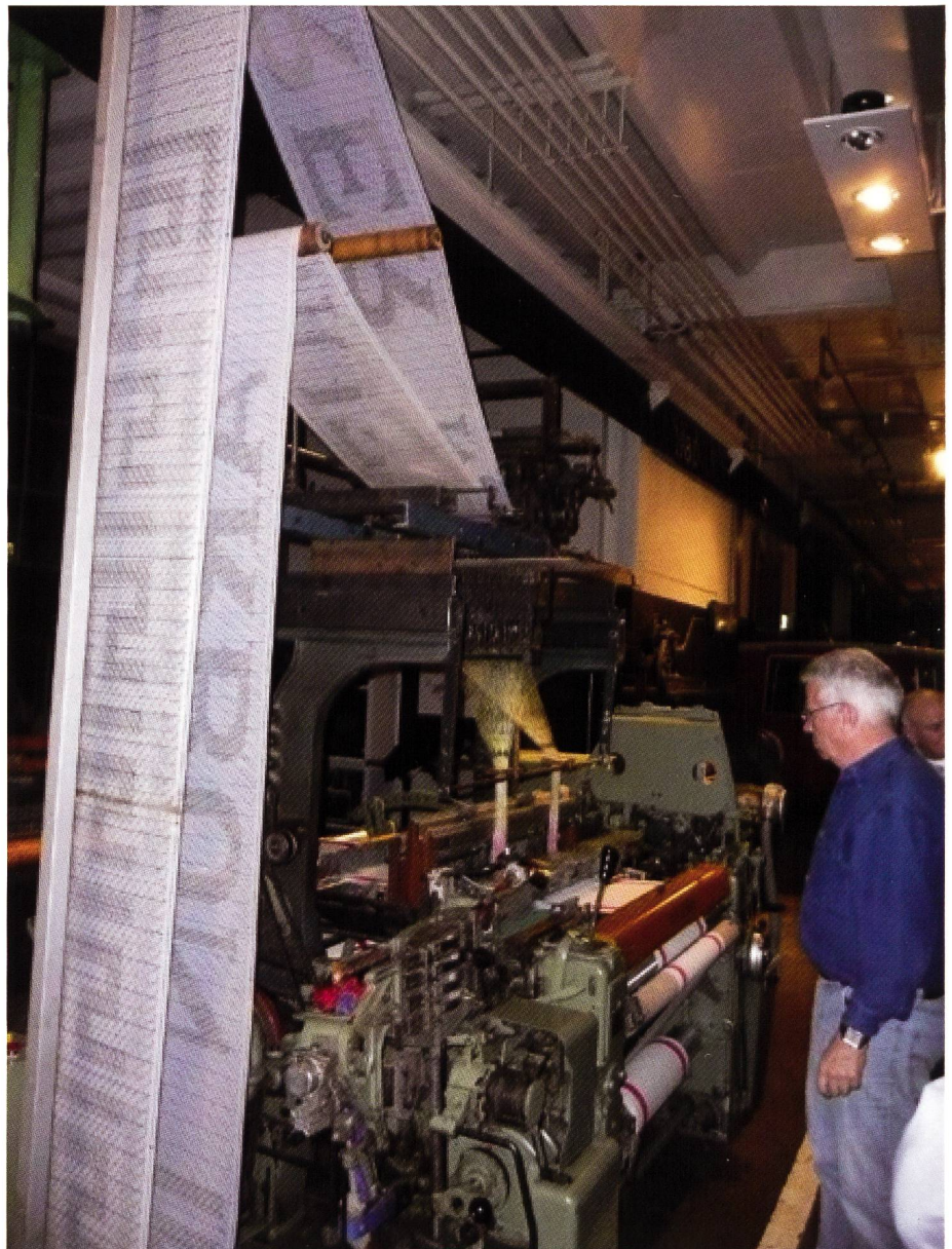
100W Tüchlimaschine Nr. 63'891 von 1978 mit aufgebauter, lochkartengesteuerter Stäubli-Nameneinwebmaschine

Saurer hatte somit einen sehr erfolgreichen und bestens entwickelten Webstuhl. Doch die Konkurrenz weltweit brachte immer mehr und leistungsfähigere Produkte. Wie Saurer darauf reagierte, wird in der nächste Ausgabe, Nr. 116 beschrieben!