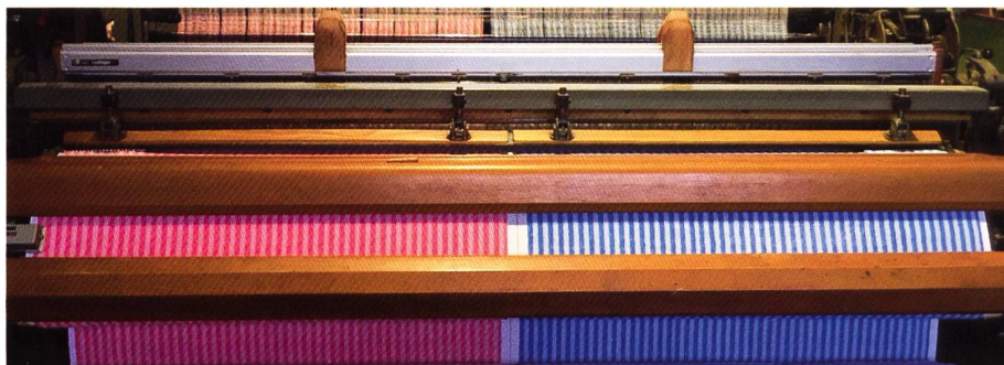
Unsere 100W für schwere Frottierstoffe

Webstühle, später Webmaschinen, waren wichtige Produkte der Firma Saurer. In diesem Bericht gehen wir der Frage nach, wie die Entwicklung dieser Produkte verlief. Es soll ein Überblick sein. Zu einzelnen Themen sind in früheren Gazetten Berichte erschienen. Wir planen später vertiefte Informationen zu verschiedenen Produkten und Entwicklungen.