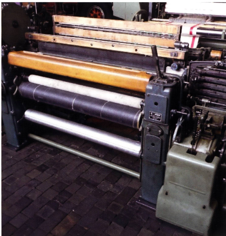
100W Webstuhl von 1948, ein 4-Farben Buntautomat

Der neue Webstuhl wurde zuerst als 1-farbig herausgebracht, kurz danach auch für 4 Farben. Dafür war auf einer Seite ein Steigkasten mit 4 Schiffli erforderlich. Diese konnten in beliebiger Reihenfolge zum Abschuss gebrachte werden. Dazu war eine Steuerung mit einer kleinen Lochkarte vorgesehen. Der Spulenwechsel erfolgte automatisch, mit einem Trommelmagazin und mit Varianten für 4 Farben. Für die Schaffbewegung gab es als einfachste Ausführung die Exzentermaschine. Für die anspruchsvolle