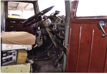
Die funktionelle, aber enge SAURER-Kabine

Kipper von Carrosserie Langenthal aufgebaut, damit dieser ebenfalls für Möbeltransporte genutzt werden konnte. Dies wurde beim V8 aber rasch wieder aufgegeben. Er kam hauptsächlich bei Kipperarbeiten, im Fernverkehr Schweiz und im Winterdienst zum Einsatz.