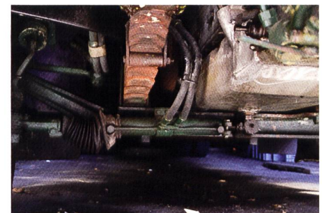
Andere Servolenkung: Beim BERNA ist der Lenkzylinder in der Spurstange eingebaut.