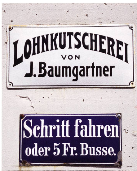
Vier Generationen Baumgartner Transporte Glarus