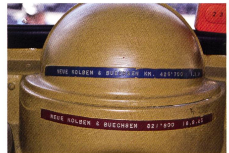
Etwa alle 400'000 km wurden Kolben und Büchsen ersetzt. Bei einer dieser Motorevisionen wurden 120mm Zylinderbüchsen eingebaut, wobei der Motor nun 180PS leistete.

Firma Frech & Hoch, Sissach, erfolgte. Und noch etwas an dieser Kabine ist speziell. BERNA Normallenker tragen auf beiden Seiten der Motorhaube gewöhnlich die Bezeichnung «SAURER DIESEL». Mit Liebe zum Detail hat Jacques Baum-