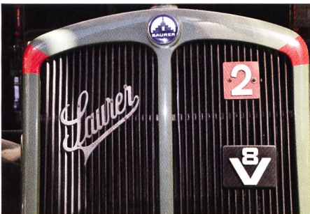
Markanter SAURER Normalenker Kühlergrill mit Scania V8-Emblem

Für Kipperarbeiten führte er oft einen 1-Achsanhänger mit, beim Bau der A3-Walenseestrasse und beim Bau der Limmernstaumauer. Für diese wurden auch Langeisen bis 18m Länge von Basel nach Linthal geführt. Für die Firma Zschokke war der V8 für den Baggertransport im Einsatz, und Elmer Citro wurde von Elm über die Tremola ins Tessin gefahren.