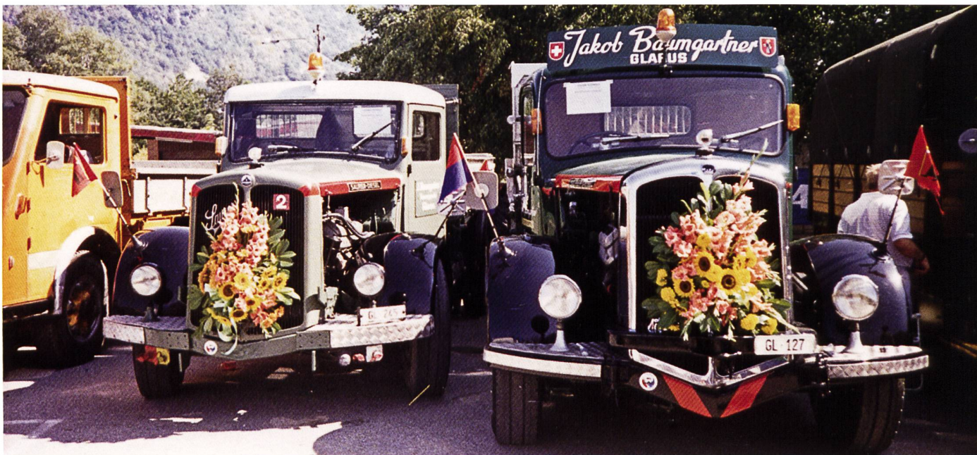
SAURER V8 1957 (links) und BERNA 5U 1959 (ex Toneatti) festlich geschmückt anlässlich eines SAURER-Treffens.

Text: Gion Item, Rhäzüns und Christoph Hürlimann, Chur