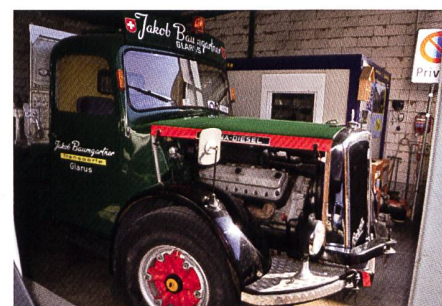
Die FBW-Führerkabine verleiht dem BERNA 5U 1959 CH2D 160/180 PS ein aussergewöhnliches Aussehen.